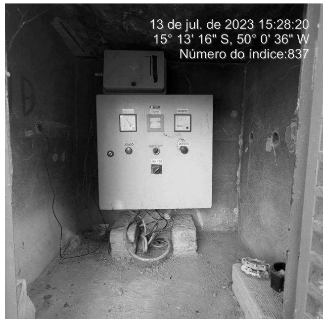
Foto 2 - Quadro de Comando sem aviso de advertência na área de risco.