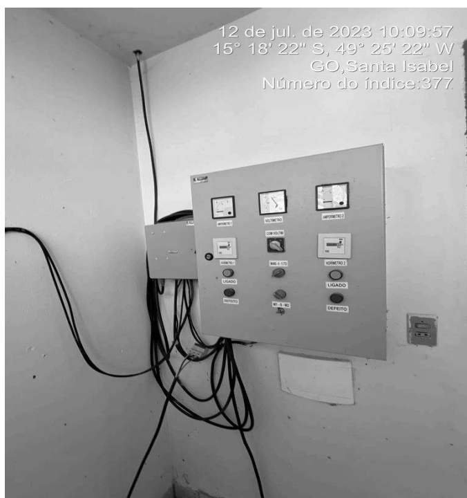
Foto 7 - Q.C. do poço PGA/781 sem aviso de risco.