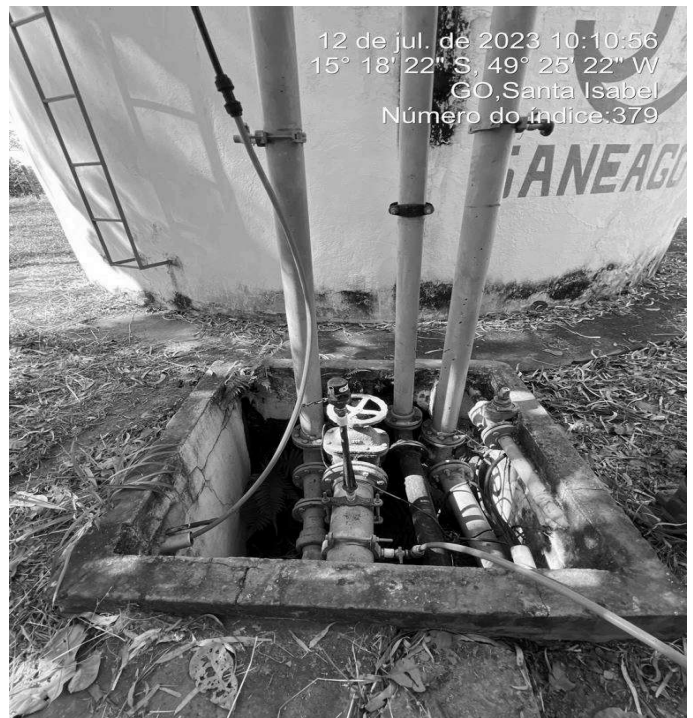
Foto 4 - RAP/C.R. Santa Isabel sem guarda corpo na escada de acesso ao topo.