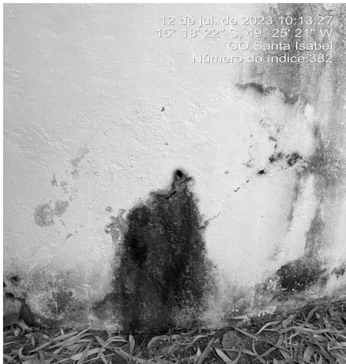
Foto 3 - RAP/C.R. Santa Isabel com infiltração.