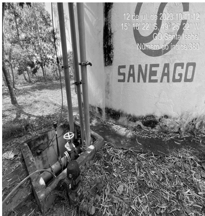
Foto 6 - Área do C.R. Santa Isabel com caixas de passagem sem grade de proteção.