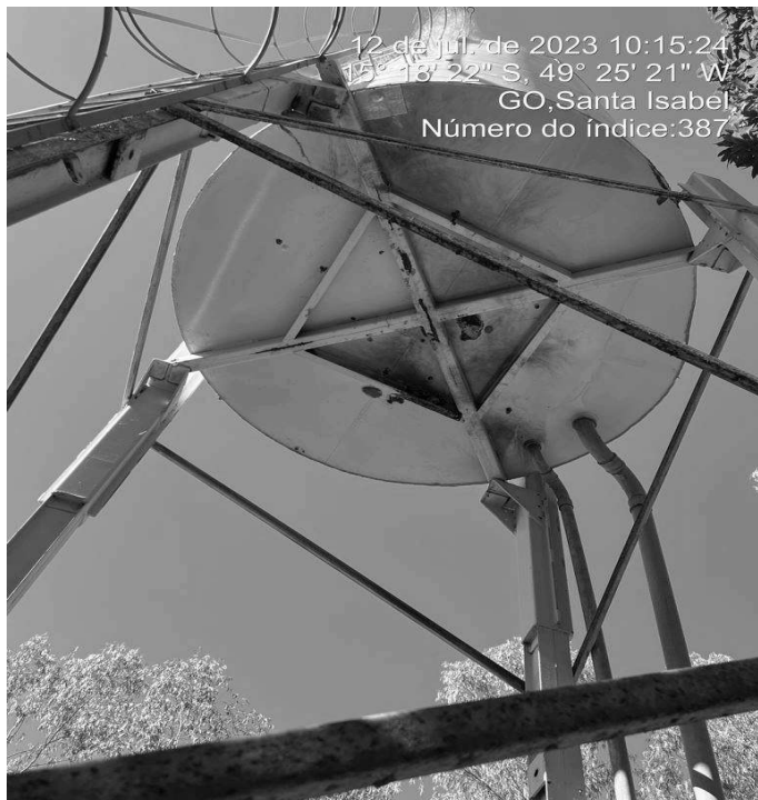
Foto 1 - REL/C.R. Santa Isabel com corrosão no fundo.