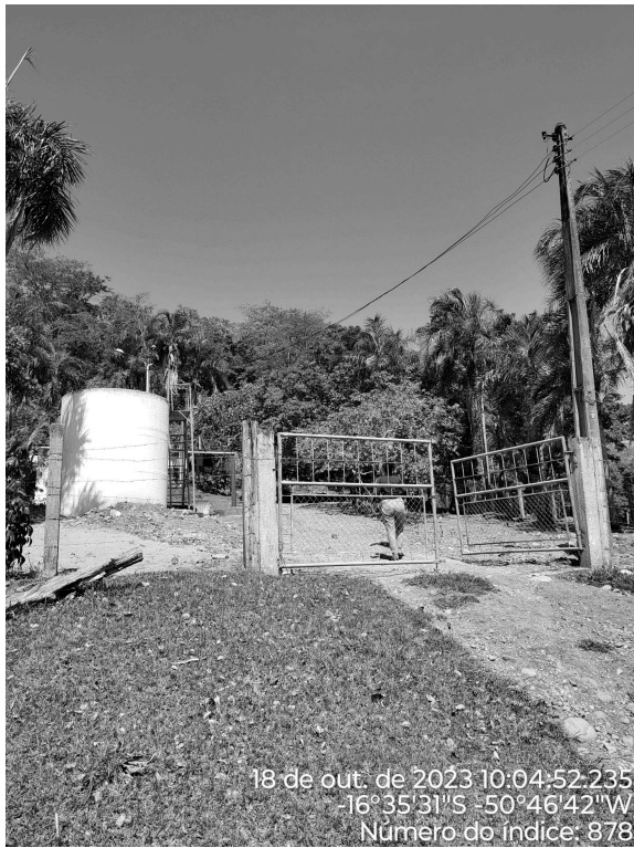
Foto 1 - ETA sem identificação.