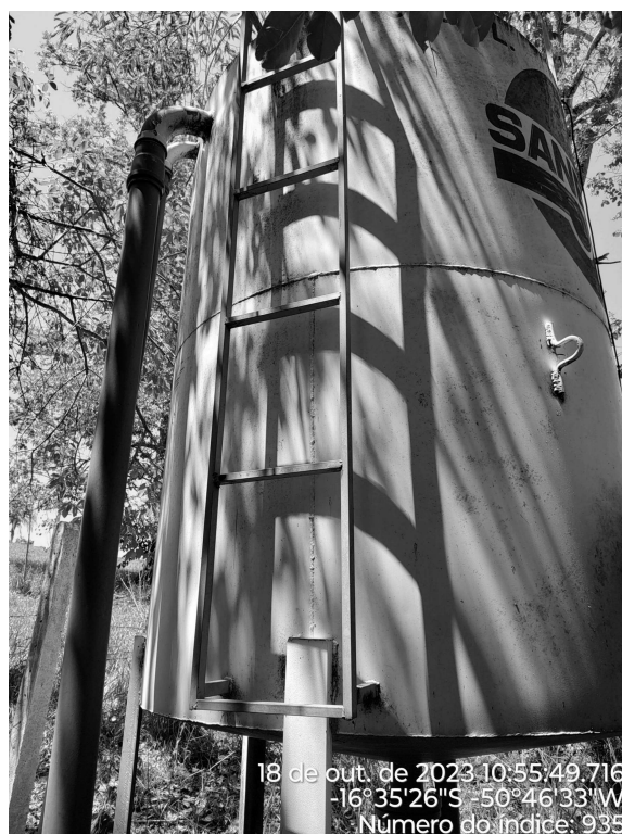
Foto 12 - REL captação com ausência de guarda-corpos.