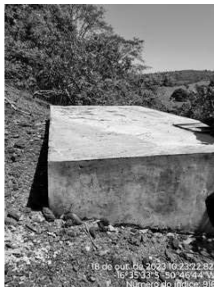
Foto 10 - Corrosão na tampa de inspeção do reservatório semi-enterrado (ETA).