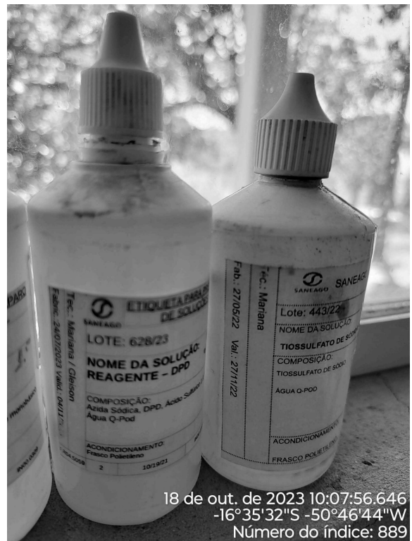
Foto 4 - Reagente vencido.