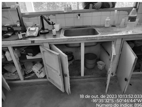
Foto 9 - Armários com portas danificadas.