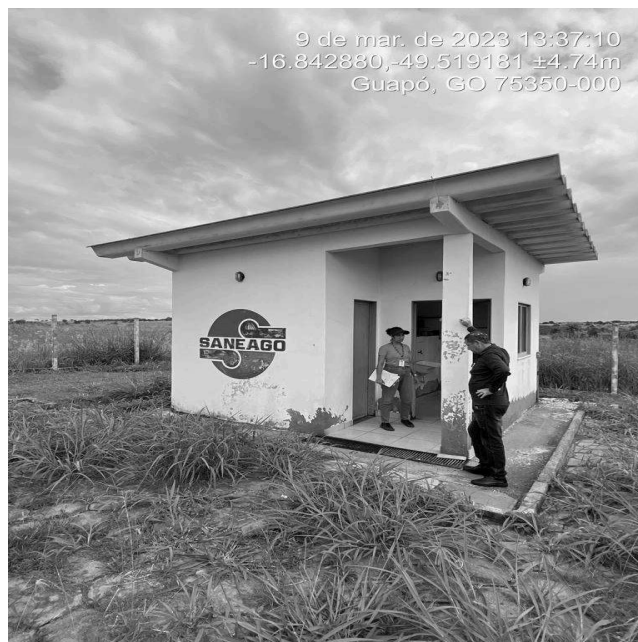
Foto 10 - Casa de química do REL Residencial Bandeira com perda de revestimento e pintura desgastada..