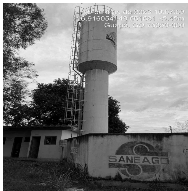
Foto 8 - REL centro (Posselândia) unidades com pintura desgastada..