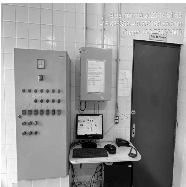
Foto 3 - Quadro de comando da EEAT/ETA área de risco sem aviso de advertência.