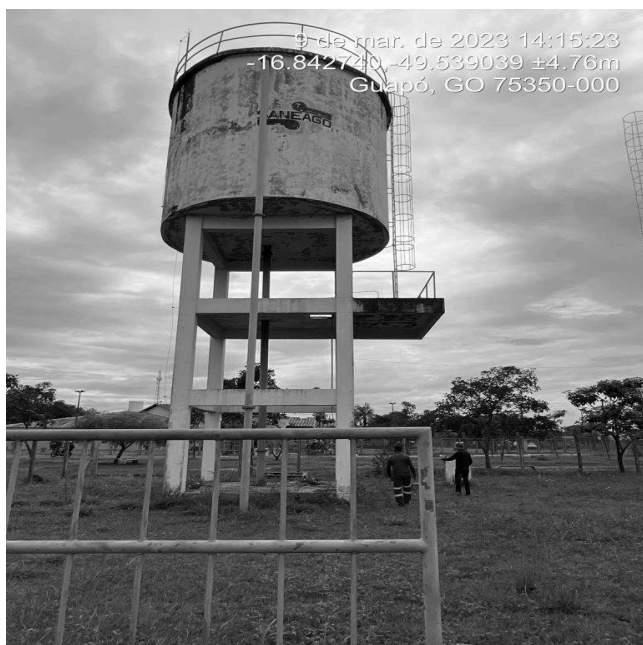
Foto 11 - REL João Rassi sem guarda corpo na parte inferior da escada de acesso ao topo do REL.