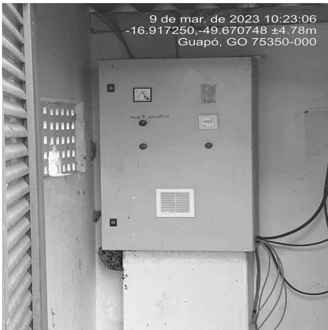
Foto 1 - Quadro de comando Poço PRI 01 com área de risco sem aviso de advertência.