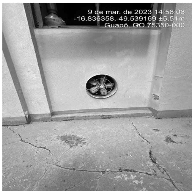
Foto 7 - ETA sala de cloração com exaustor danificado.