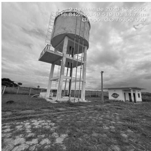
Foto 9 - REL Residencial Bandeira com pintura desgastada.