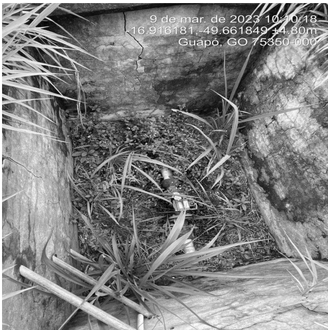
Foto 13 - Caixa do macromedidor sem tampa ou grade de proteção na área do REL centro (Posselândia).