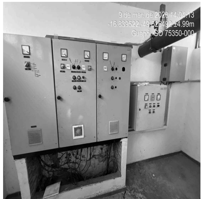
Foto 2 - Quadro de comando da EEAB com área de risco sem aviso de advertência.