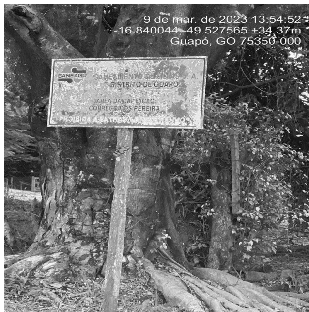
Foto 6 - EEAB/Captação com placa de identificação danificada.