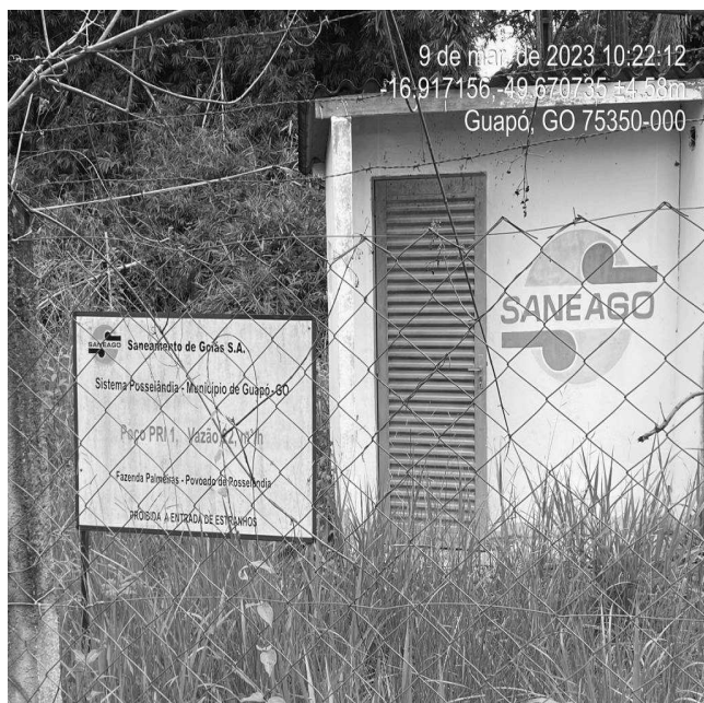
Foto 5 - Poço PRI 01 quadro de comando com área de risco sem aviso de advertência.