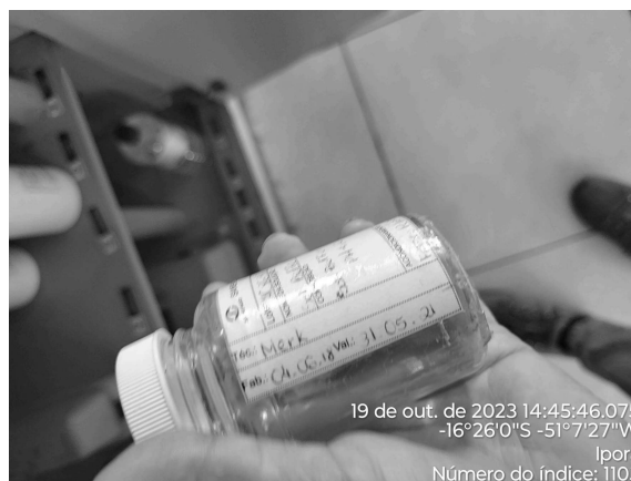
Foto 4 - Reagentes vencido.