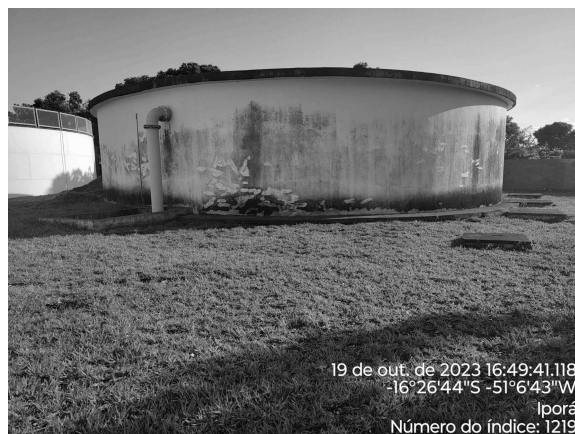
Foto 16 - RAP 1000 m 3 CR R1 com pintura desgastada.