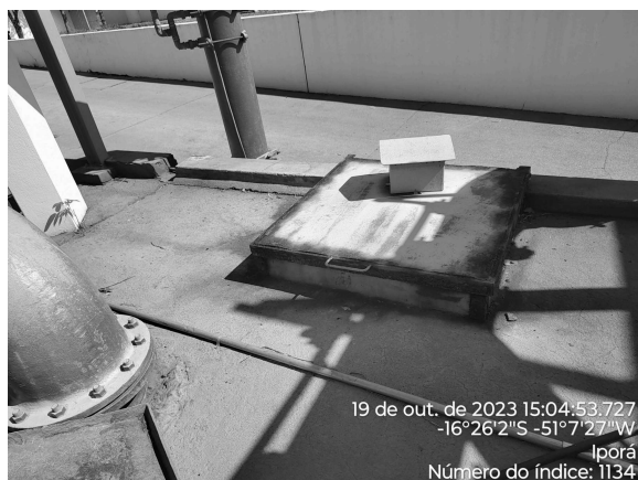
Foto 17 - Presença de corrosão nas tampas do Reservatório Enterrado ETA (tanque de contato).