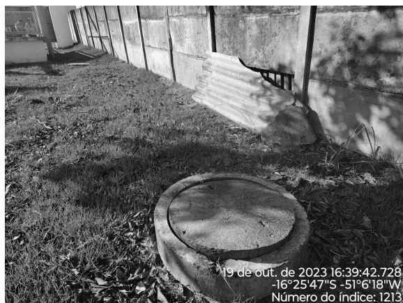
Foto 13 - Área do booster Pará com muro lateral danificado.