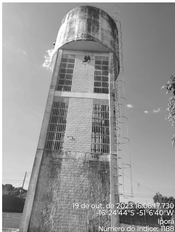
Foto 11 - Pintura desgastada e presença de vazamento na base do REL Águas Claras.