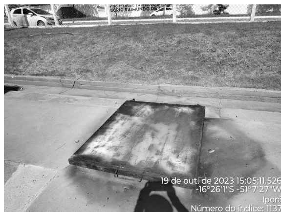
Foto 18 - Presença de corrosão nas tampas do Reservatório Enterrado ETA (tanque de contato).