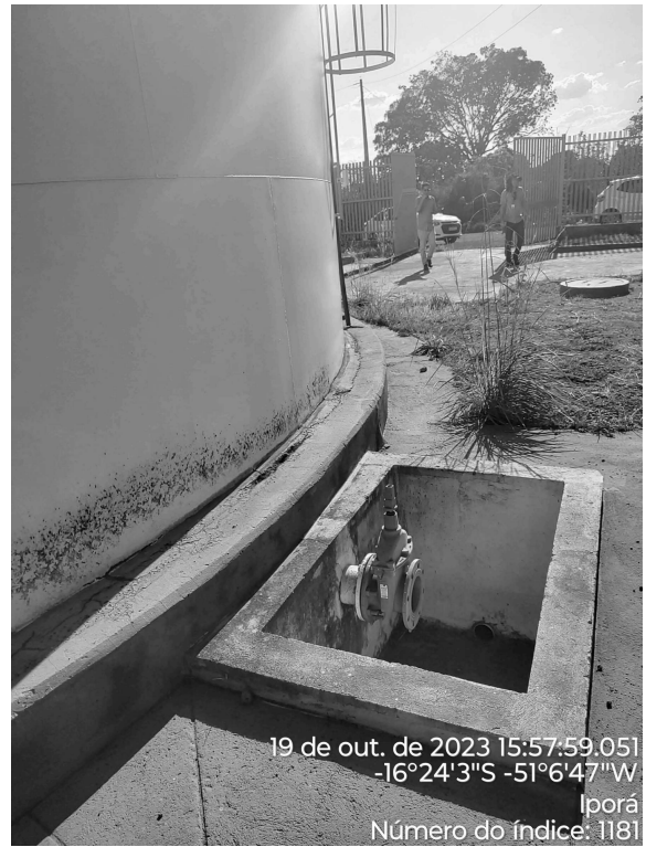
Foto 6 - RAP Nova Iporá com caixa de passagem sem tampa ou grade de proteção adequada.