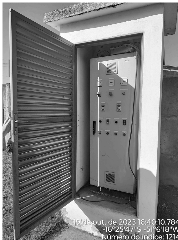
Foto 2 - Área de risco do Booster Avenida Pará sem aviso de advertência.