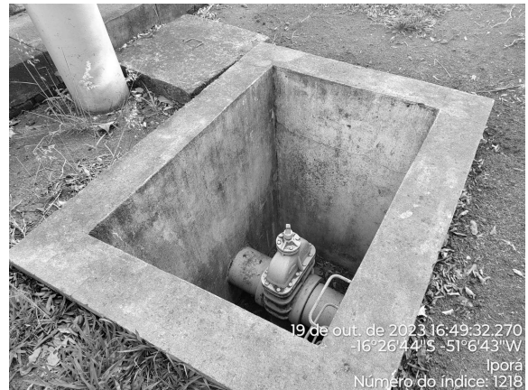
Foto 8 - CR R1 com caixa de passagem sem tampa ou grade de proteção adequada.