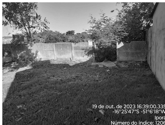
Foto 12 - Área do booster Pará com muro de fundo danificado.