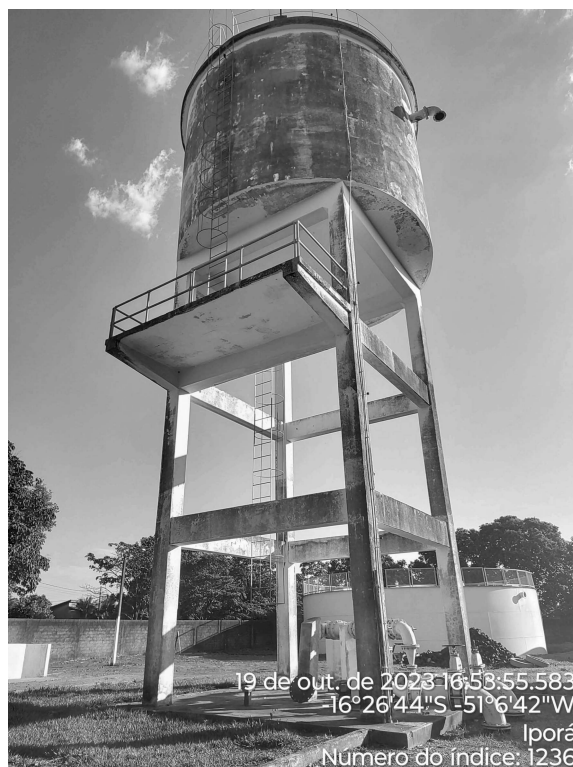
Foto 14 - REL 200 m 3 CR R1 com pintura desgastada.