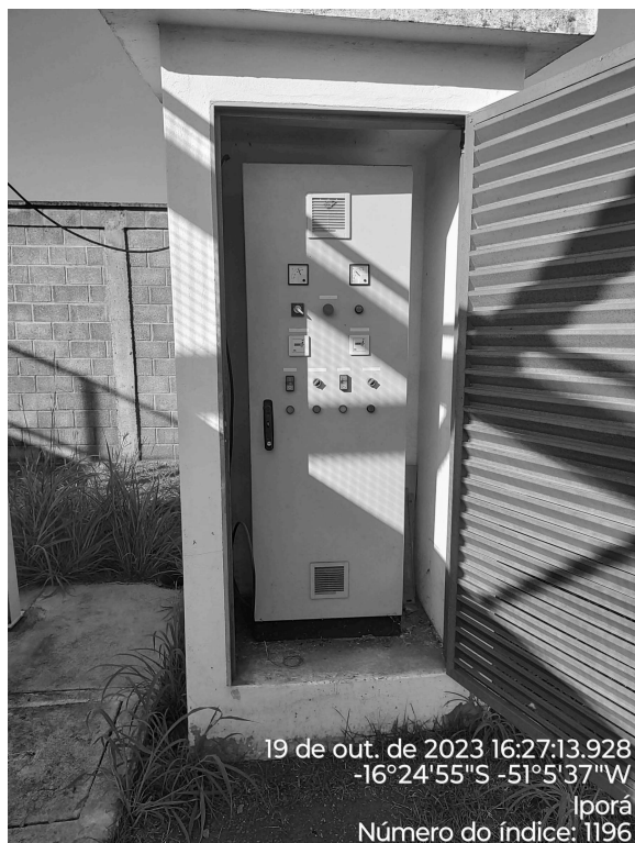
Foto 1 - Área de risco da EEAT Residencial Califórnia sem aviso de advertência.