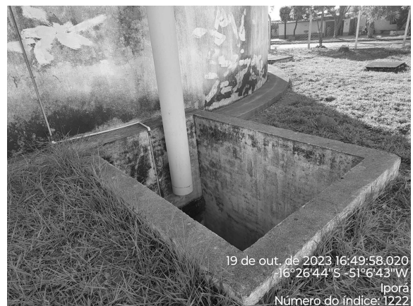
Foto 10 - CR R1 com caixa de passagem sem tampa ou grade de proteção adequada.