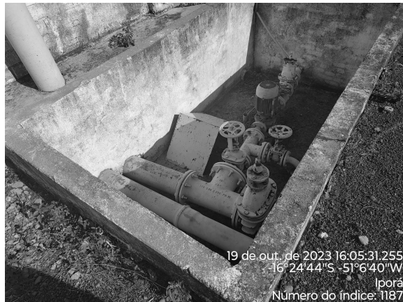
Foto 7 - REL Residencial Águas Claras com caixa de passagem sem tampa ou grade de proteção adequada.