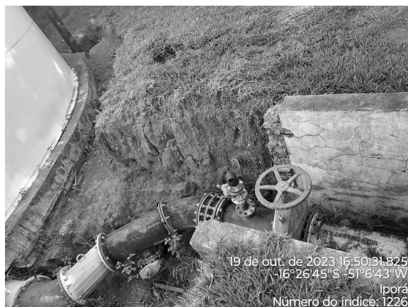
Foto 9 - Caixa de passagem CR R1 danificada.