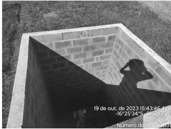
Foto 5 - CR R2 com caixas de passagem sem tampa ou grade de proteção adequada.