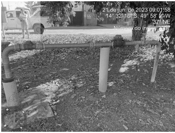
Foto 19 - Poço 350 com ausência de identificação, cerca de proteção e portão.