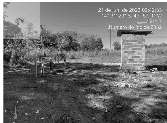
Foto 18 - Poço 343 com ausência de identificação, pintura, cerca de proteção e portão.