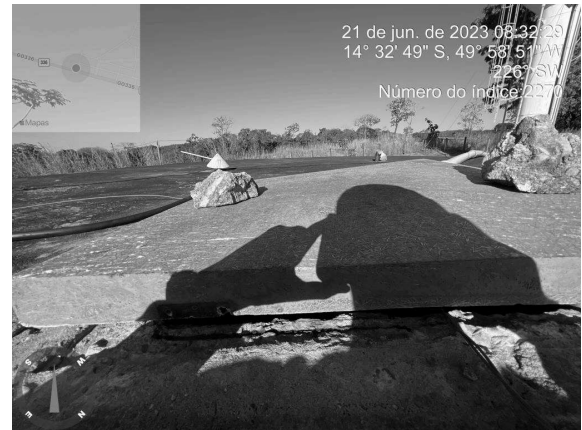
Foto 14 - Tapa de inspeção do Reservatório Apoiado do CR Pedro Machado fechada de forma inadequada, com blocos de concreto.