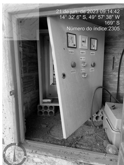
Foto 9 - Tampa do quadro de comando danificada no Booster Novo Horizonte.