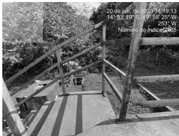
Foto 4 - Guarda-corpo do floclador danificado e com corrosão na área da ETA.