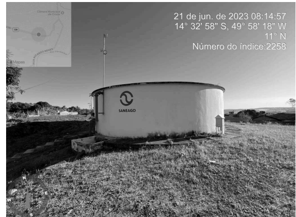
Foto 16 - Caixa de passagem aberta no Reservatório Apoiado Centro.