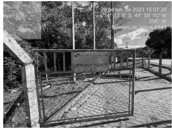
Foto 20 - Poço 15 com placa de identificação danificada e ilegível e ausência de cadeado no portão.