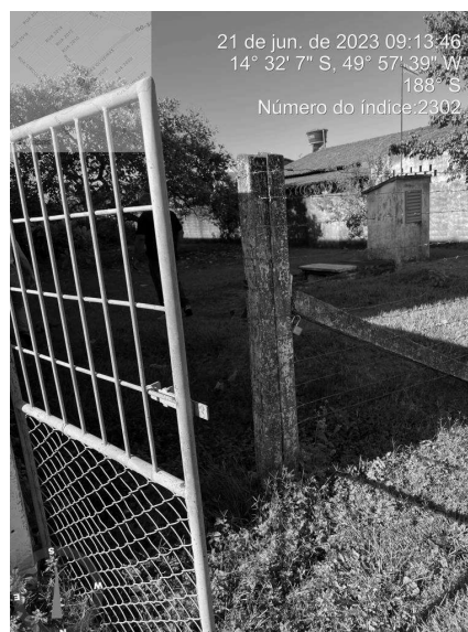
Foto 8 - Ausência de identificação no Booster Novo Horizonte.