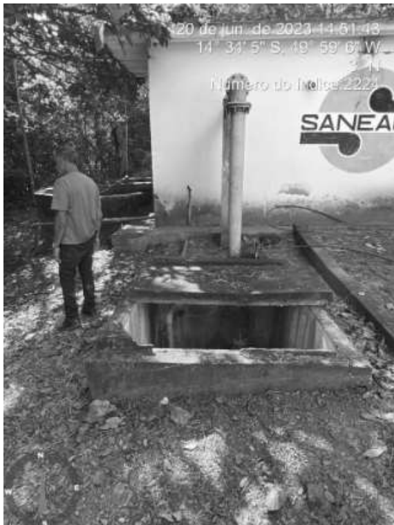
Foto 1 - Caixa de passagem com tampa danificada na EEAB.