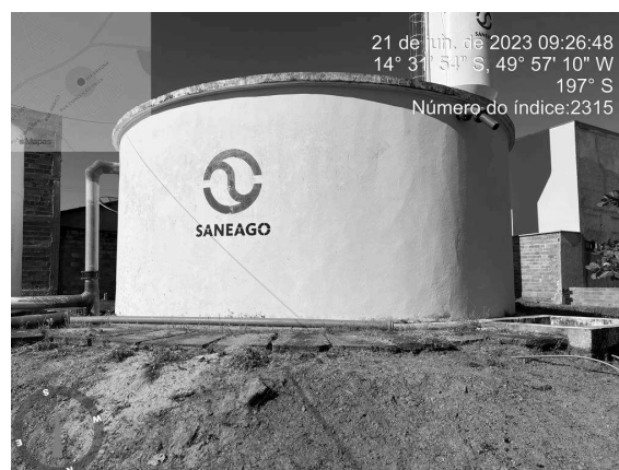
Foto 10 - Ausência de guarda-corpo no Reservatório Apoiado do CR Novo Horizonte.