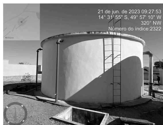
Foto 12 - Caixa de passagem aberta no Reservatório Apoiado Novo Horizonte e ausência de guarda corpo.