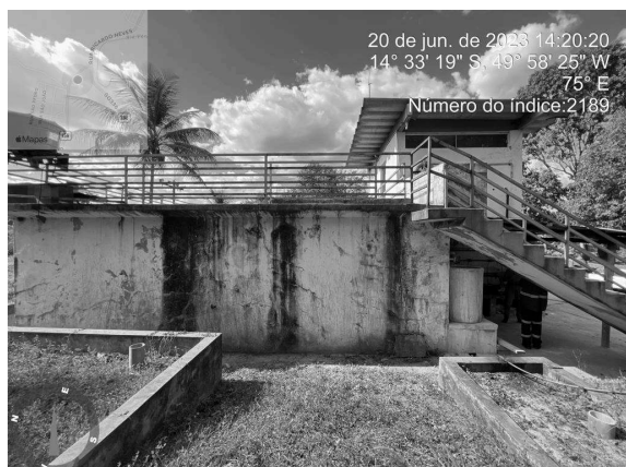
Foto 5 - Edificações da ETA com pintura desgastada e presença de infiltrações.