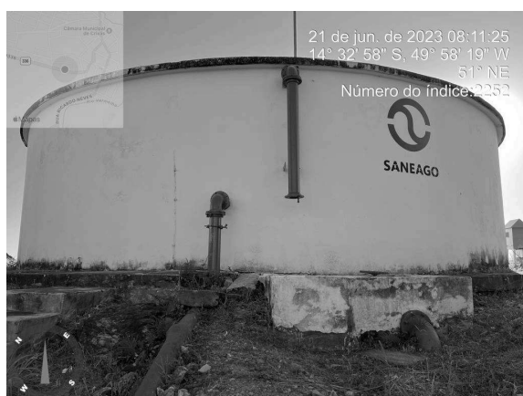
Foto 11 - Ausência de guarda-corpo no Reservatório Apoiado Centro.