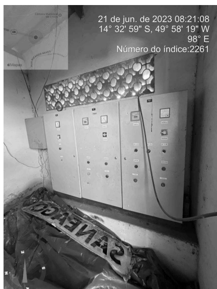
Foto 7 - Ausência de aviso de risco nas EAT's Setor Pedro Machado.