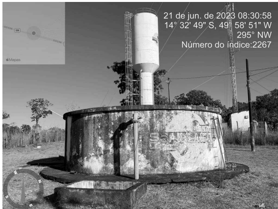
Foto 15 - Pintura desgastada no Reservatório Apoiado do CR Pedro Machado.