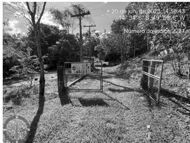
Foto 2 - Placa de identificação danificada e ilegível na EEAB.