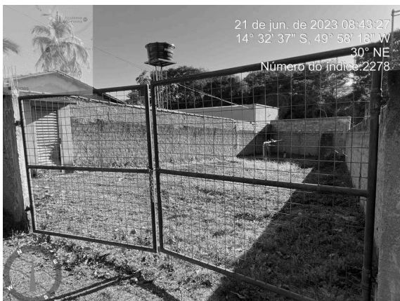
Foto 17 - Ausência de identificação no Poço 349.