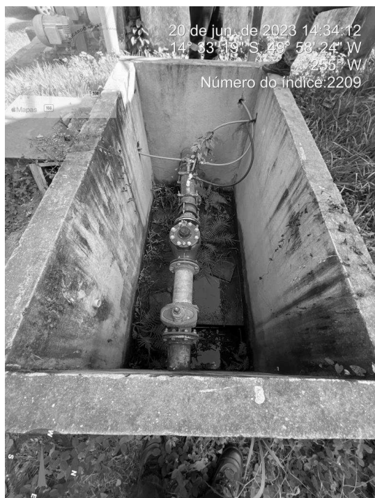
Foto 3 - Presença de caixa de passagem sem tampa ou grade de proteção na área da ETA.