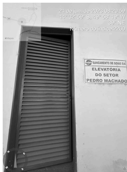
Foto 6 - Ausência de aviso de risco nas EEAT's Setor Pedro Machado.