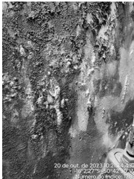
Foto 5 - Presença de infiltrações e eflorescências na galeria dos filtros.