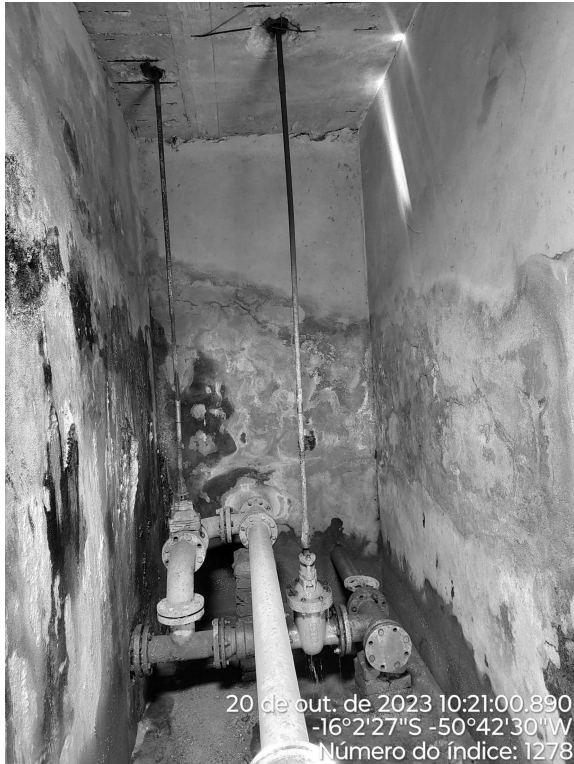
Foto 3 - Vazamento nos registros da galeria dos filtros