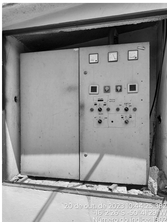
Foto 1 - Quadro de comando da captção/poço sem aviso de advertência.