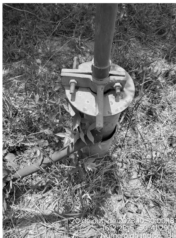
Foto 2 - Ausência de laje de proteção no Poço captação.