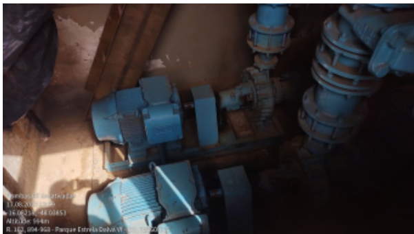
Foto 3 - Local da válvula redutora de pressão - setor Minas Gerais.