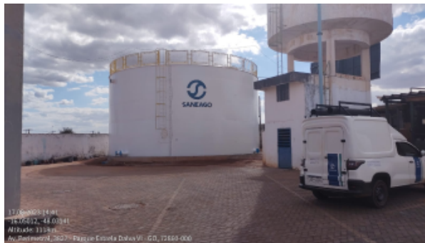
Foto 4 - Filtro russo desativado, quadra 672, lote 11 - setor Pedregal.