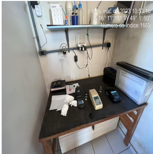
Foto 3 - Ausência de armários adequados para guardar vidrarias e reagentes

Foto 2 - Ausência de guarda-corpos na escada de acesso ao topo da ETA Compacta.