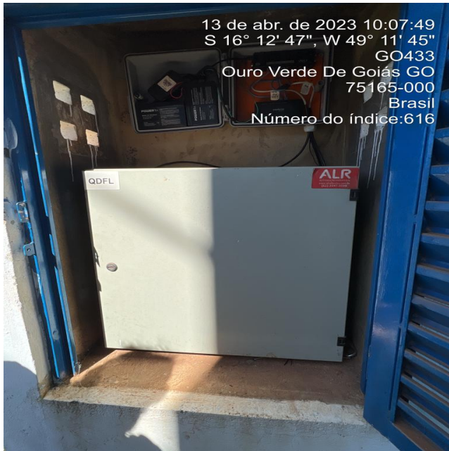
Foto 3 - EEAT/Booster Recanto das Pedras com quadro de comando sem aviso de risco.