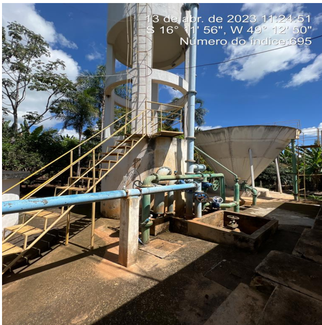
Foto 1 - ETA/Filtro Russo com pintura desgastada.