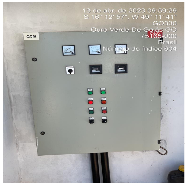
Foto 2 - EEAT/Belo Horizonte com quadro de comando sem aviso de risco.