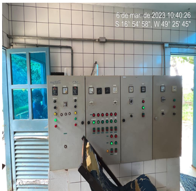
Foto 7 - Quadro de comando da EEAT sem aviso de advertência.