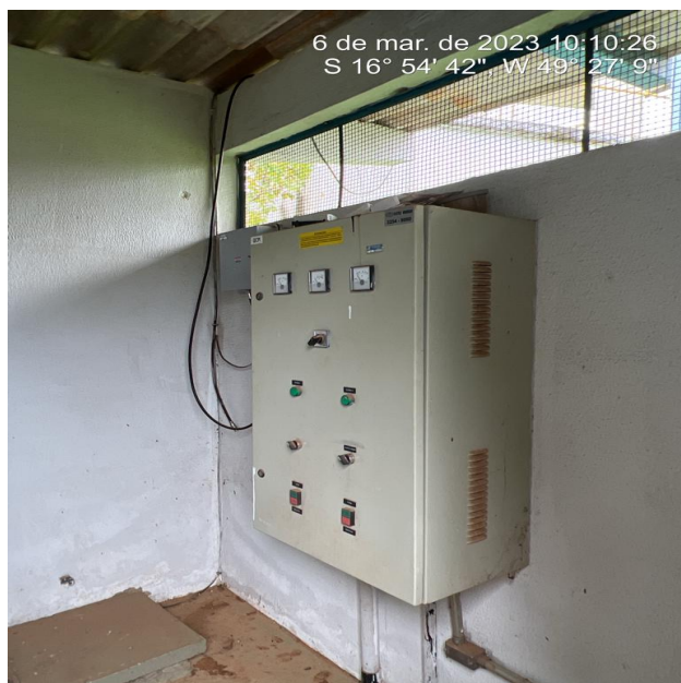
Foto 15- Poço com área de risco sem aviso de advertência.