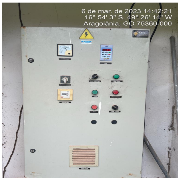
Foto 13- Poço com área de risco sem aviso de advertência.