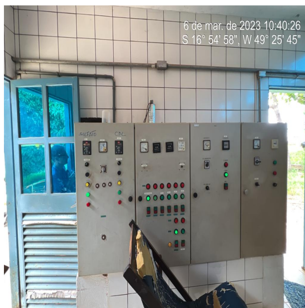
Foto 2 - Quadro de comando da ETA e Captação /EEAB, sem aviso de advertência (no laboratório da ETA).