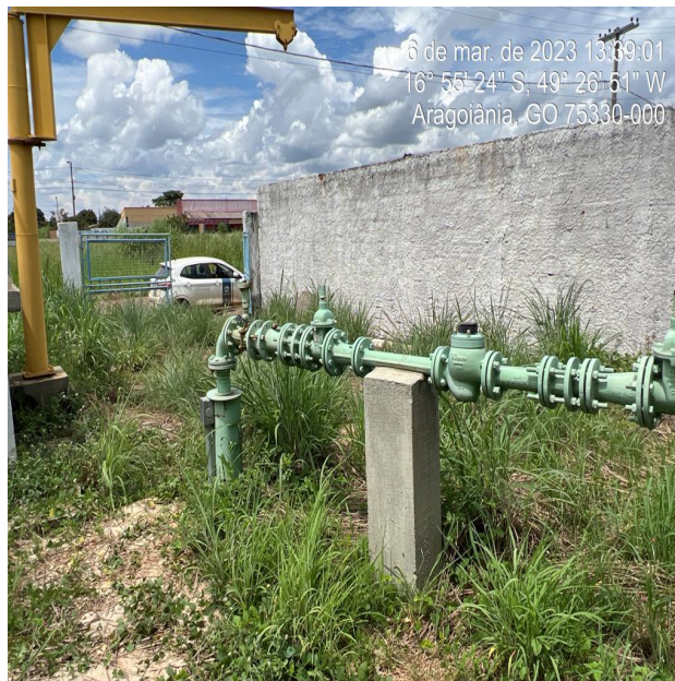
Foto 22 - C.R. Parque das Acácias poço com área urbanizada com mato alto.