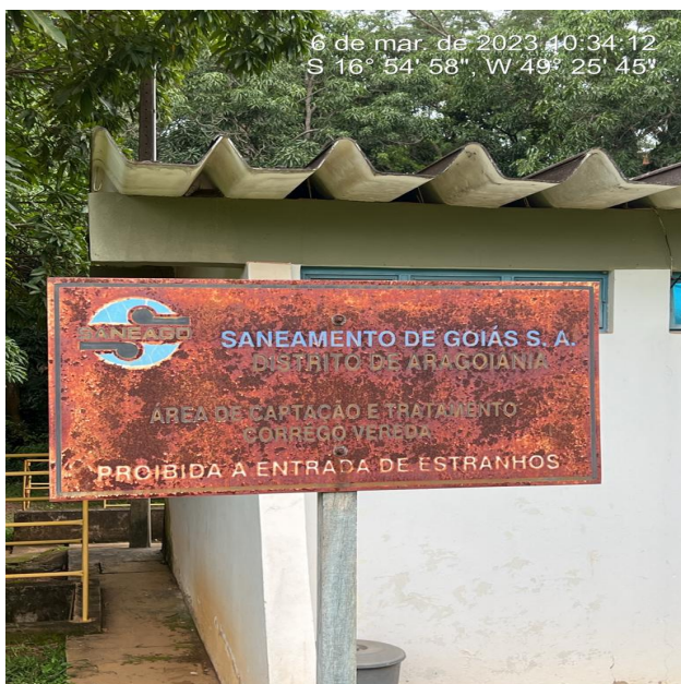
Foto 1 - Placa de identificação da ETA desgastada.