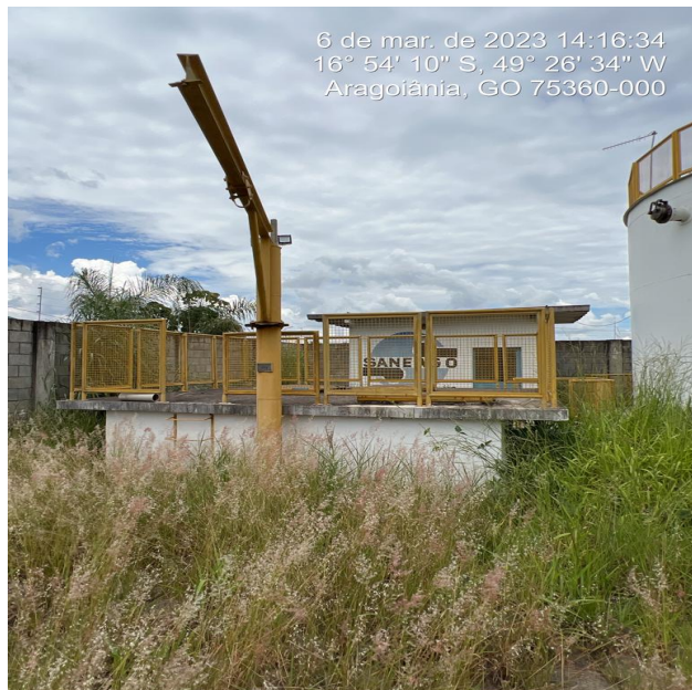
Foto 21- Área urbanizada do C.R. Parque das Acácias com mato alto.