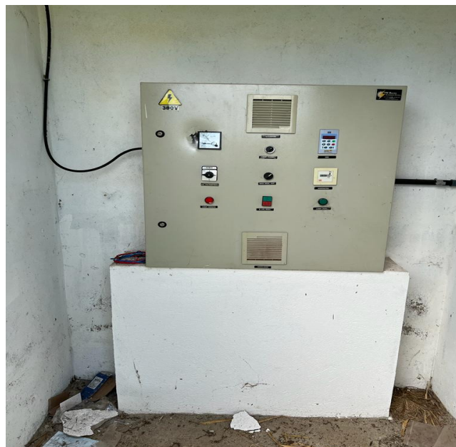
Foto 8 - EEAT/C.R. Portal Dourado com área de risco sem aviso de advertência.