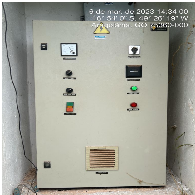
Foto 12 - Poço com área de risco sem aviso de advertência.