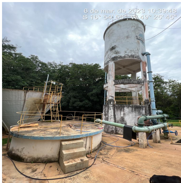
Foto 6 - Edificações da ETA com pintura desgastada.