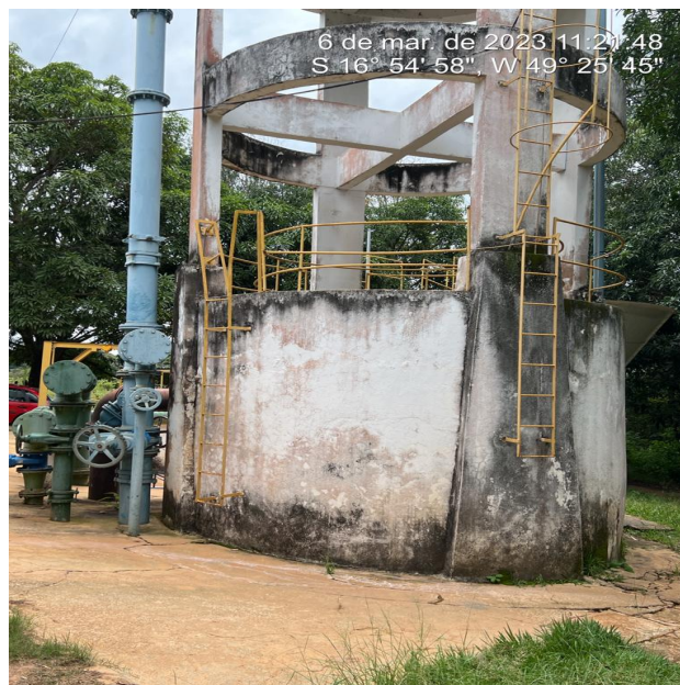
Foto 4 - Ausência de guarda-corpos na escada dos filtros da ETA.