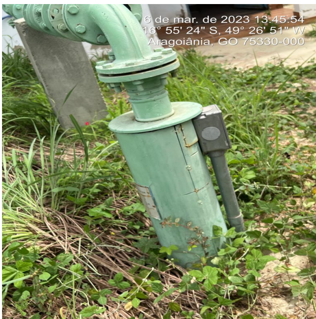
Foto 19- C.R. Vitória com mato alto na área urbanizada.