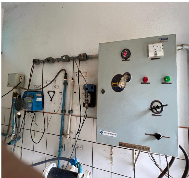
Foto 9 - EEAT/C.R. Parque das Acácias com área de risco sem aviso de advertência.