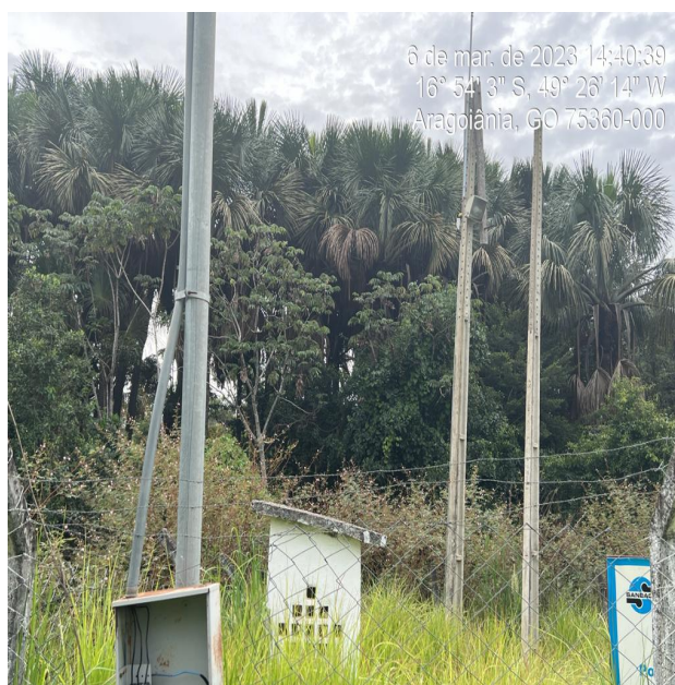
Foto 24 - Parque das Acácias - poço mato alto e sistema de energia danificado (relógio medidor).