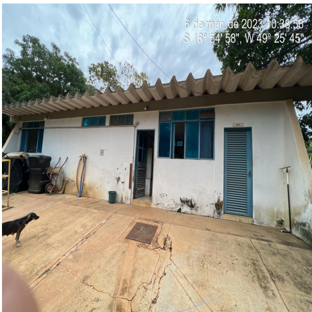
Foto 5 -Edificações da ETA com pintura desgastada.