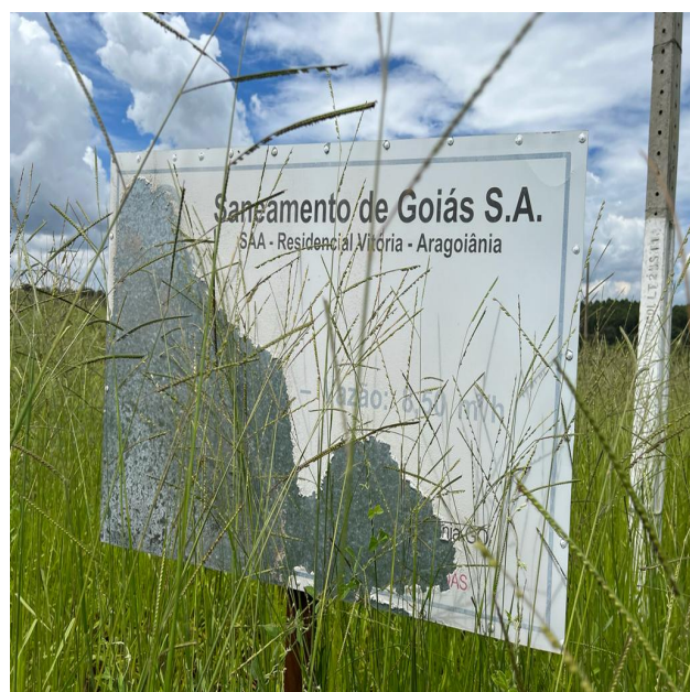
Foto 23- Parque das Acácias - poço com área em meio a mato alto.