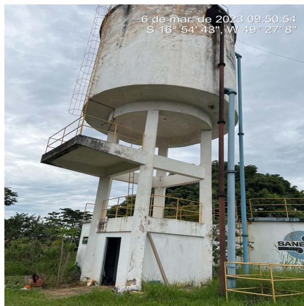
Foto 16 - Ausência de guarda-corpo na parte inferior da escada do REL/escritório.