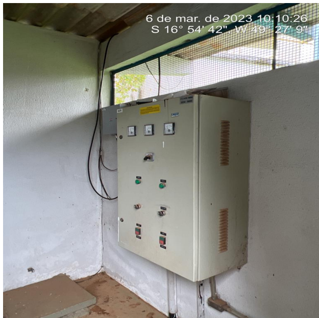
Foto 10 - EEAT/C.R. Vitória com área de risco sem aviso de advertência.