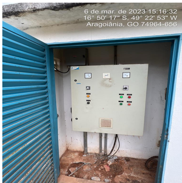
Foto 14 - Poço com área de risco sem aviso de advertência.