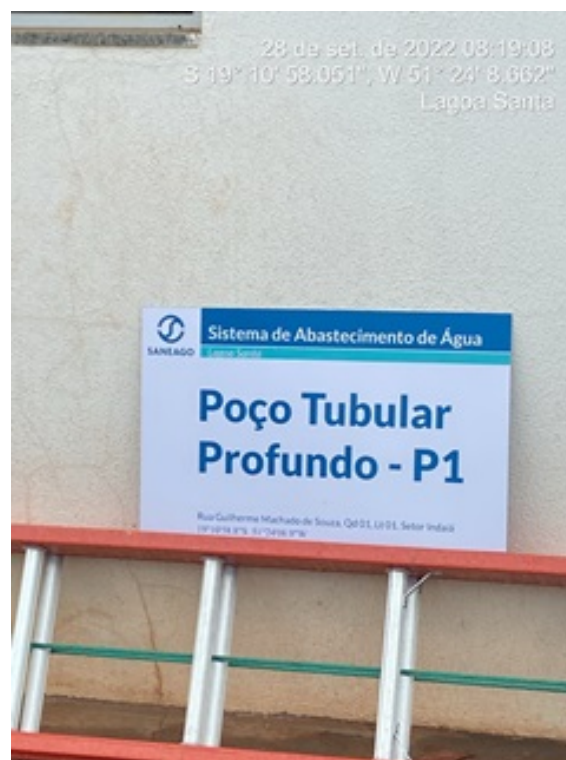
Foto 2 - Placa de identificação do poço.