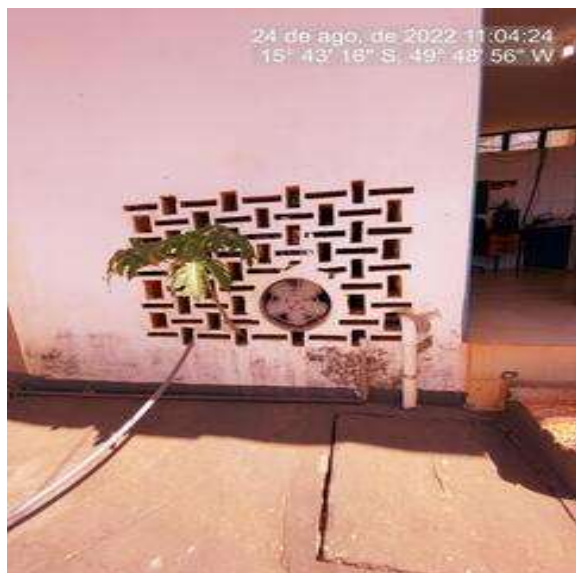
Foto 3 - Sala de química da ETA com exaustor funcionando.