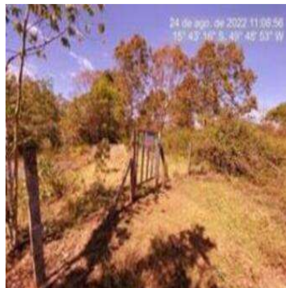
Foto 4 - Captação com cerca de proteção recuperada.