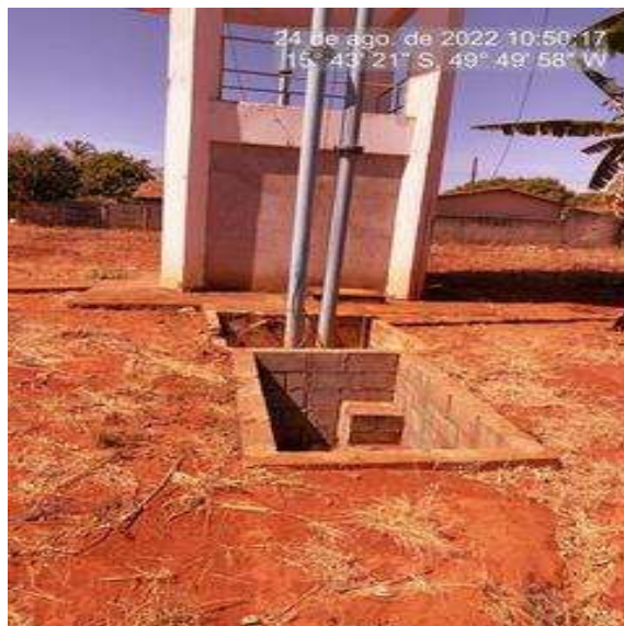
Foto 2 - REL com caixa de passagem recuperada. Colocar grade de proteção.