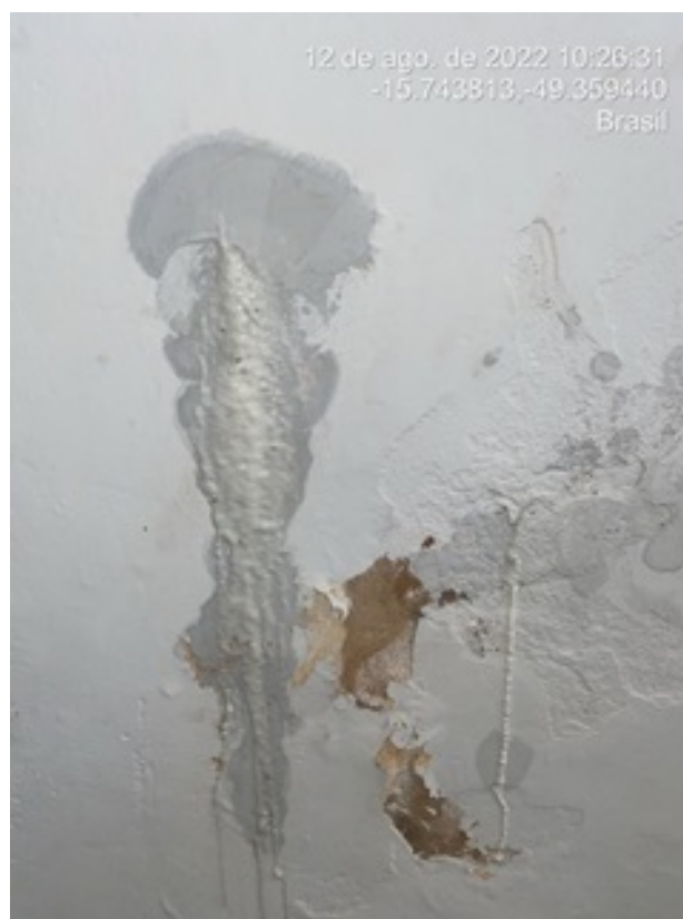
Foto 8 - ETA/Galeria dos filtros em detalhes, com novas infiltrações e eflorescências.