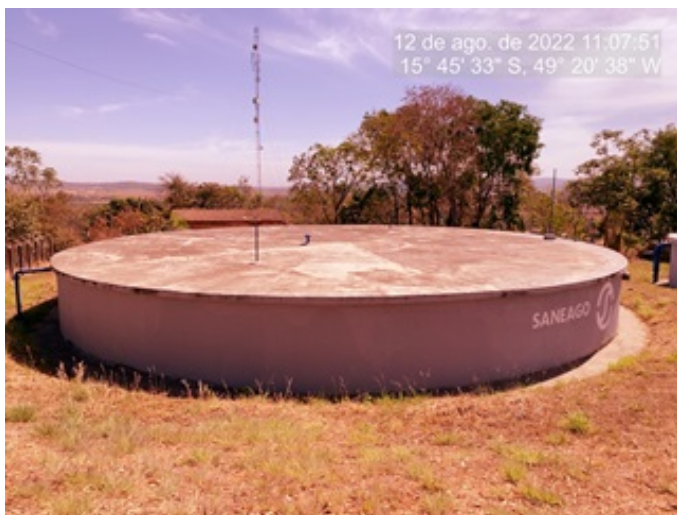
Foto 5 - Ferragem da borda do RAP R1 recuperada