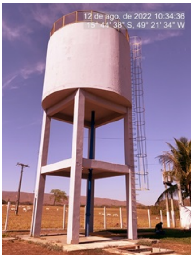
Foto 3 - REL da ETA com pintura recuperada.