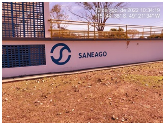
Foto 2 - Pintura recuperada, eflorescências e perda de revestimento corrigidas na ETA.