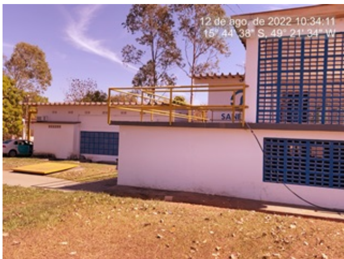
Foto 1 - Pintura recuperada, eflorescências e perda de revestimento corrigidas na ETA.