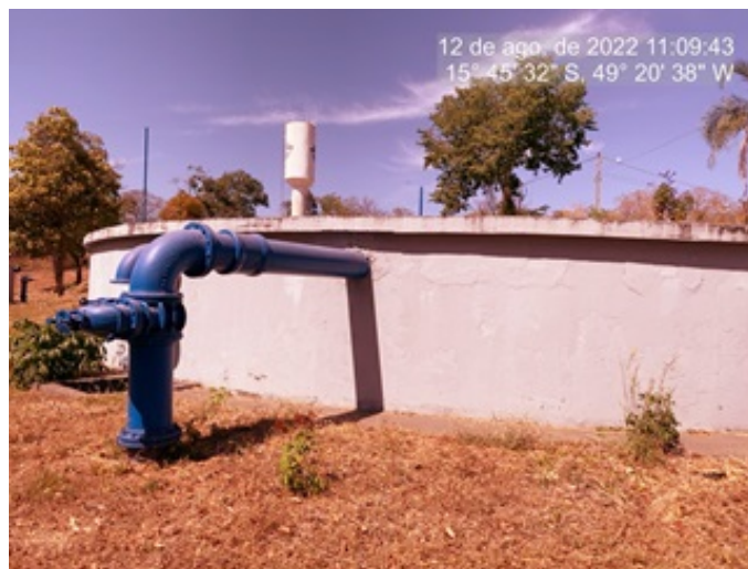
Foto 6 - Ferragem da borda do RAP R2 recuperada.