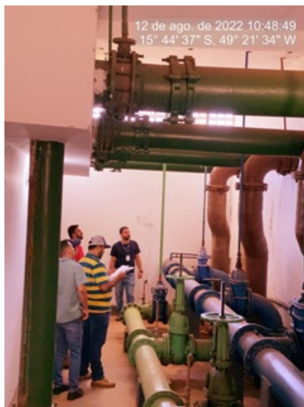
Foto 4 - Galeria dos filtros com vazamentos corrigidos.