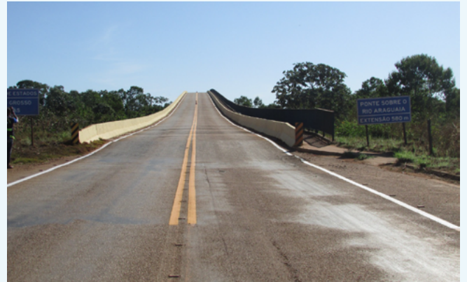
Ponte Cocalinho é administrada pelo Consórcio Caminhos do Sol