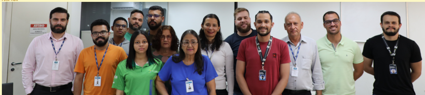
Equipe da Gerência de Tecnologia da AGR

a produção de relatórios gerenciais e painéis de dados interativos voltados para decisões de negócios.