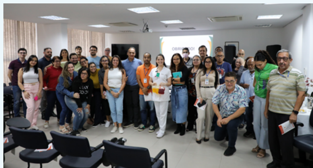
Vivian ao lado dos colaboradores que assistiram à palestra