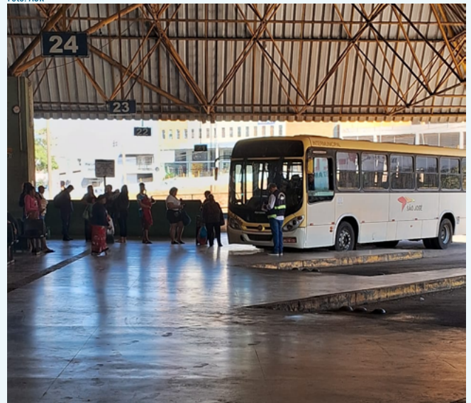
Ambiente favorece experimentos para melhoria do transporte