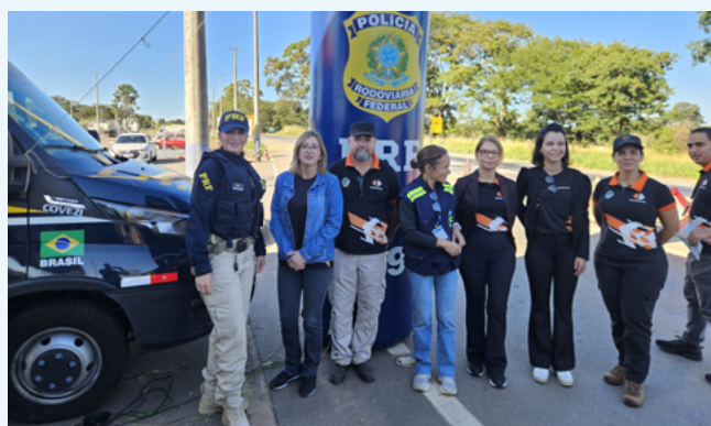
Lançamento da Operação Maio Amarelo, da PRF, em Hidrolândia