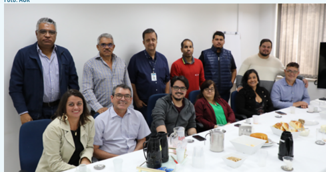
Quarta edição do Café com o Presidente