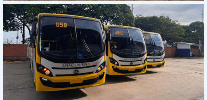
Investimentos somam cerca de R$ 22 milhões e trazem conforto aos usuários