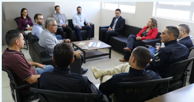
Equipe da AGR na sede da PRF - GO

Objetivo é dar mais efetividade às ações dos fiscais com a integração de dados e serviços de inteligência. Acordo marca as ações da Agência durante campanha Maio Amarelo promovida pelo Observatório Nacional de Segurança Viária