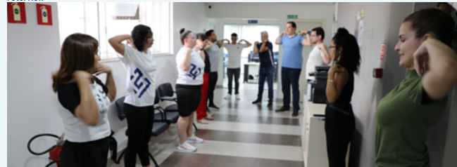
Colaboradores do 12º andar do edifício-sede em atividade de ginástica laboral

A ginástica laboral reduz o risco de lesões por esforço repetitivo, melhora a postura, aumenta a flexibilidade, reduz dores musculares e articulares, melhora a vitalidade muscular e mental, aumenta a capacidade respiratória, melhora a qualidade do sono e reduz o estresse e a ansiedade, entre outros benefícios.