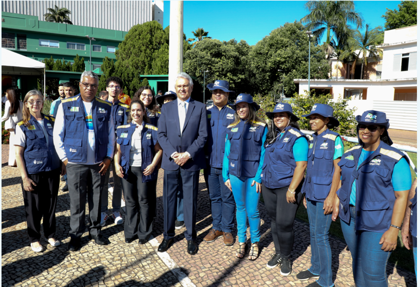
O governador Ronaldo Caiado com a equipe da AGR no lançamento da Temporada

A AGR é um dos órgãos parceiros do governo na Temporada Mais Araguaia 2025, lançada pelo governador Ronaldo Caiado em 27 de junho, na Praça Cívica. Por meio da AGR Móvel, uma van equipada para o atendimento a usuários dos serviços públicos delegados, equipes da Ouvidoria Setorial da Agência levaram informações sobre direitos e deveres relativos aos serviços de saneamento básico, energia elétrica, transporte intermunicipal de passageiros e bens desestatizados à população do Vale do Araguaia.