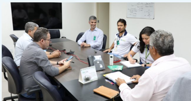
Reunião de avaliação do contrato de metas 2024/2025

A AGR recebeu, no início de junho, uma equipe da Superintendência de Fiscalização Técnica dos Serviços de Energia da Agência Nacional de Energia Elétrica (Aneel) para uma reunião técnica de avaliação do Contrato de Metas da AGR referentes aos exercícios de 2024 e 2025.