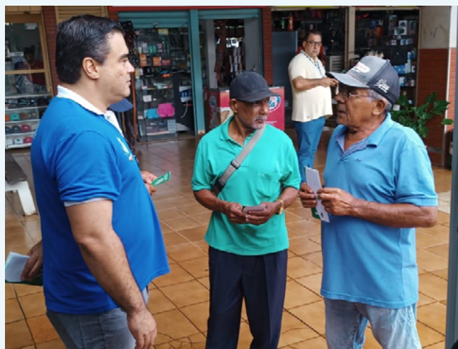
Pessoas idosas podem viajar até quatro vezes no mês