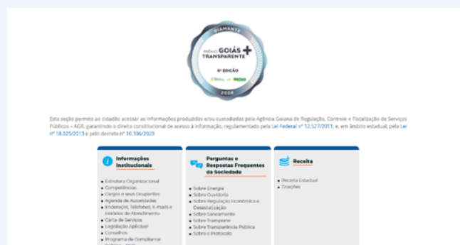
Informações atualizadas no portal de Acesso à Informação da AGR

As atualizações, que visam a sétima edição do Prêmio Goiás Mais Transparente, incluíram mudanças nos itens: Documentos institucionais, com a inclusão do Relatório Anual de Gestão, do Plano Estratégico 2025-2026 e da Agenda Regulatória 2025-2026; Informações de pessoal e patrimônio, com a disponibilização de listas de estagiários, cargos e seus ocupantes, servidores terceirizados, além de dados sobre bens móveis, imóveis e veículos; Perguntas e respostas frequentes, em que o setor de Transparência