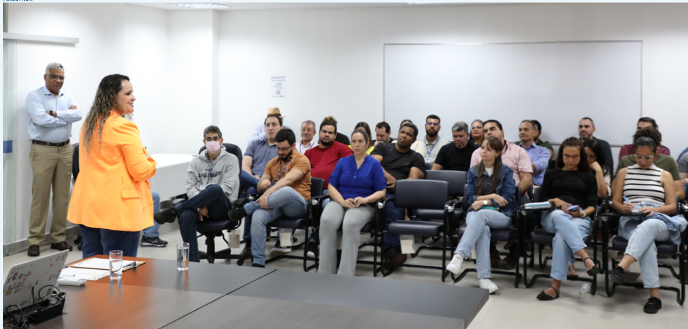
Colaboradores recebem orientações sobre como tornar o trabalho mais efetivos com o POP