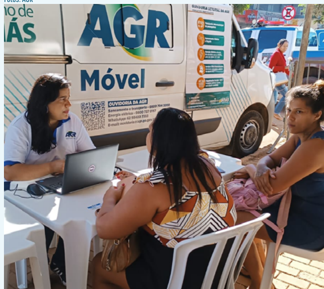
Equipe da AGR Móvel faz atendimento em evento da Alego em Formosa