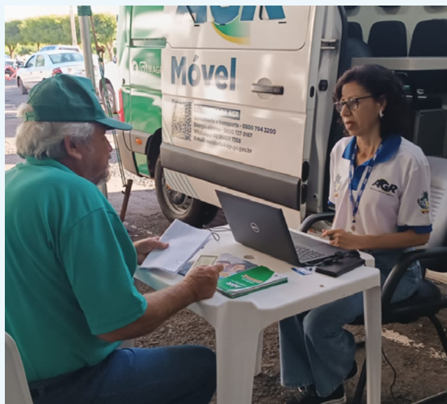
Usuário de serviços públicos de Formosa recebe orientações da AGR Móvel

Entre abril e junho deste ano, a AGR reforçou seu compromisso com a população por meio do programa Ouvidoria Itinerante, percorrendo 17 municípios em parceria com programas como o Goiás Social, Agro é Social e eventos da Assembleia Legislativa. Com atendimentos presenciais, a iniciativa levou informações sobre tarifas sociais, gratuidades no transporte de passageiros e direitos dos usuários de serviços regulados, como saneamento, energia e transporte intermunicipal. Foram 702 atendimentos itinerantes no trimestre, totalizando 950 no semestre em 29 municípios.