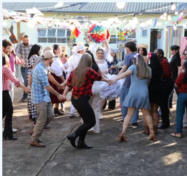
Muita animação na quadrilha improvisada