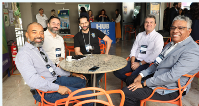
Presença da AGR no lançamento do Plano Goiás Inteligente