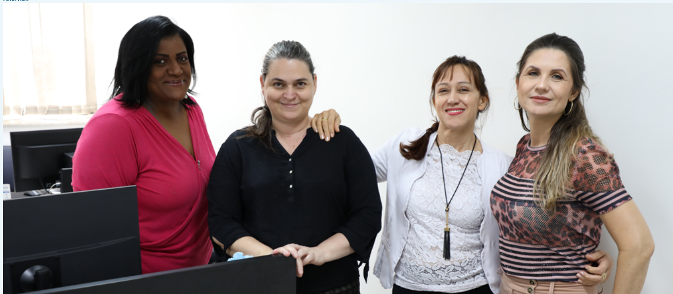
Equipe do Núcleo de Cobrança da Gerência de Finanças e Dívida Ativa

A Agência Goiana de Regulação (AGR) acaba de ampliar o alcance de seu sistema eletrônico de cobrança de dívidas implementado em 2023. Desde maio, uma nova aplicação também permite enviar, de forma digital, títulos para protesto em cartórios de outros estados do País e não apenas em Goiás, como vinha sendo feito até aquele momento.