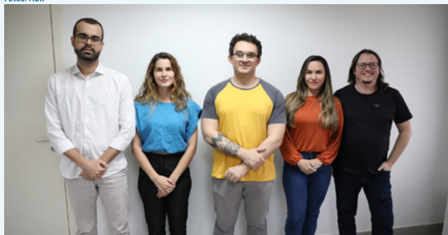
Integrantes do Escritório de Compliance da AGR

A AGR realizou uma série de ações para atualizar e aprimorar a página de Acesso à Informação, na parte superior da home do site oficial da Agência, num trabalho que envolveu a colaboração de diversas áreas, entre elas as diretorias, as gerências, coordenações e outras unidades complementares. Esteve à frente desse processo a Coordenação de Monitoramento de Programas Institucionais da AGR, vinculada à Chefia de Gabinete e responsável por diversas atividades de acompanhamento e monitoramento, dentre eles, os prêmios do PCP, que são: Governança, Goiás Mais Transparente, Ética e Responsabilidade e Ouvidoria Pública.