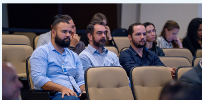
Equipe da AGR na solenidade de inauguração do Ceartt