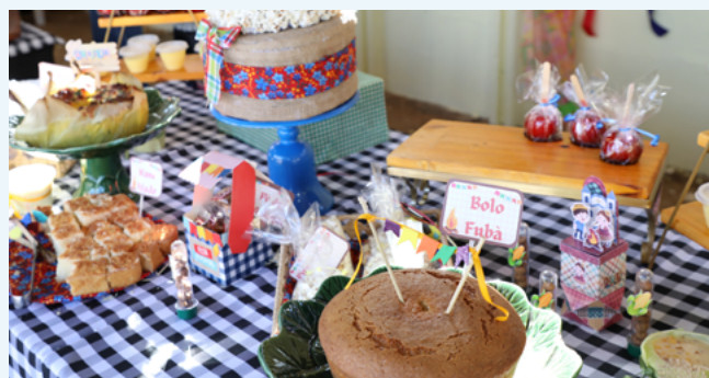
Mesas fartas de doces e outras comidas típicas

A Festa Junina faz parte do calendário institucional da AGR e está entre as ações voltadas para o bem-estar do servidor. Em tempos de tanto desafio, é também um lembrete: trabalhar com seriedade não impede que se celebre com alegria.