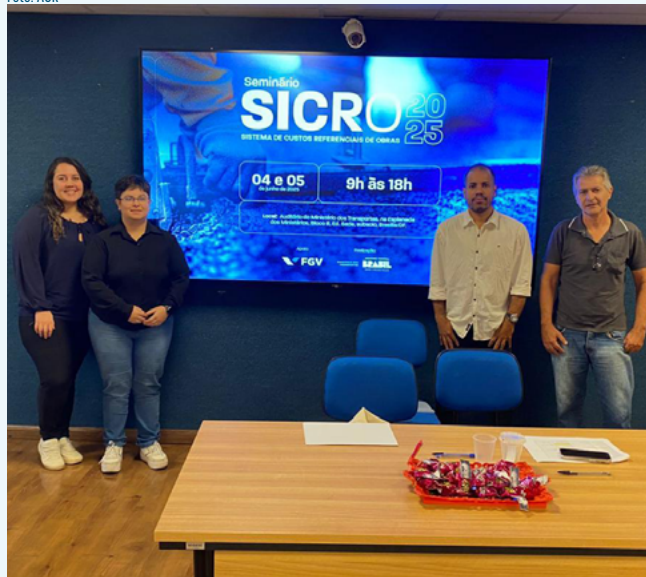
Técnicos da AGR em Brasília, no evento da Aneel