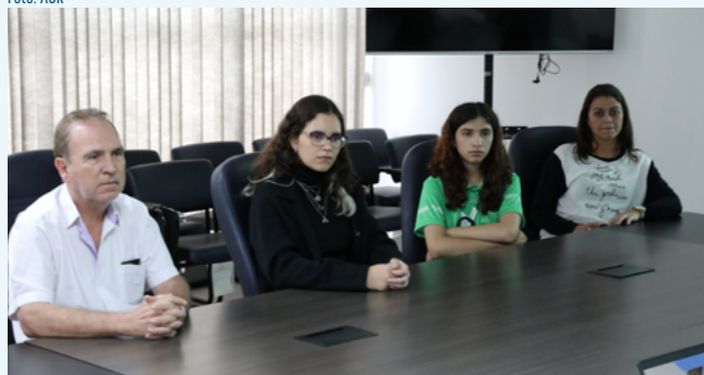
Momento possibilita apresentação dos recém-chegados