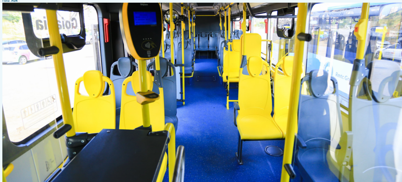
Decisões do Conselho permitem investimentos em veículos e em infraestrutura do BRT