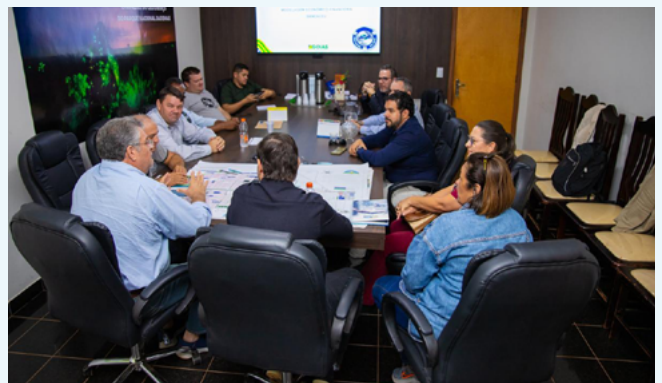
AGR e Saneaceu se reuniram em três oportunidades em Chapadão do Céu