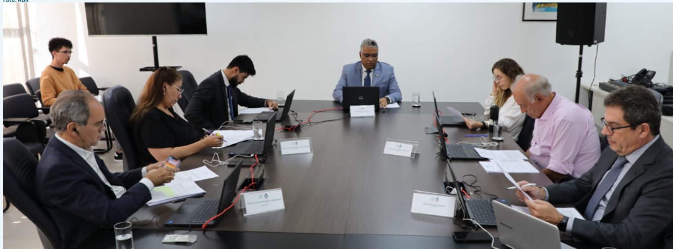
8ª Sessão do Conselho Regulador

O Conselho Regulador da AGR realizou, de abril a junho, seis sessões ordinárias e duas extraordinárias, julgando 403 processos, totalizando 725 julgados só neste ano. Num esforço para dar mais celeridade às análises e julgamentos, os conselheiros colocaram em pauta 307 processos dentro do prazo de 45 dias de tramitação, tendo sido pautados para julgamento 96 fora desse prazo.