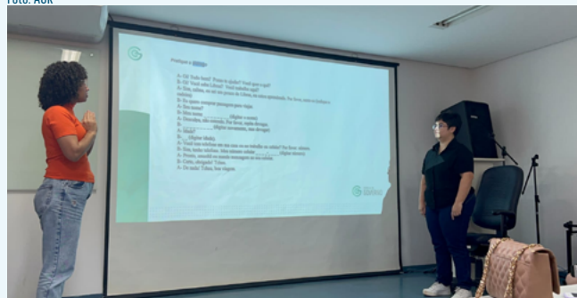
Integrantes do Comitê da Diversidade no curso de Libras