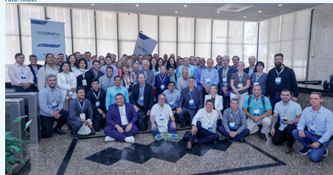
Presença da AGR no evento da Aneel