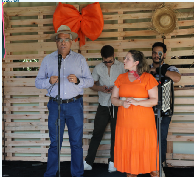
Abertura do Arraiá