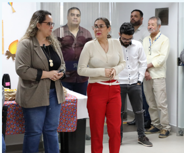
Colaboradores falam de experiências inovadoras

O presidente informou, ainda, que a frota de veículos da AGR foi ampliada e ganhou nova plotagem, incluindo a van da AGR Móvel, que ganha estrutura de atendimento com cadeiras e mesas retráteis. “O estado é grande, e a AGR precisa ir aos municípios, acompanhar as ações sociais do Governo do Estado, da Assembleia Legislativa e da Emater, entre outras, e em breve teremos também internet na AGR Móvel, para que a equipe esteja conectada em qualquer canto do estado”, afirmou.