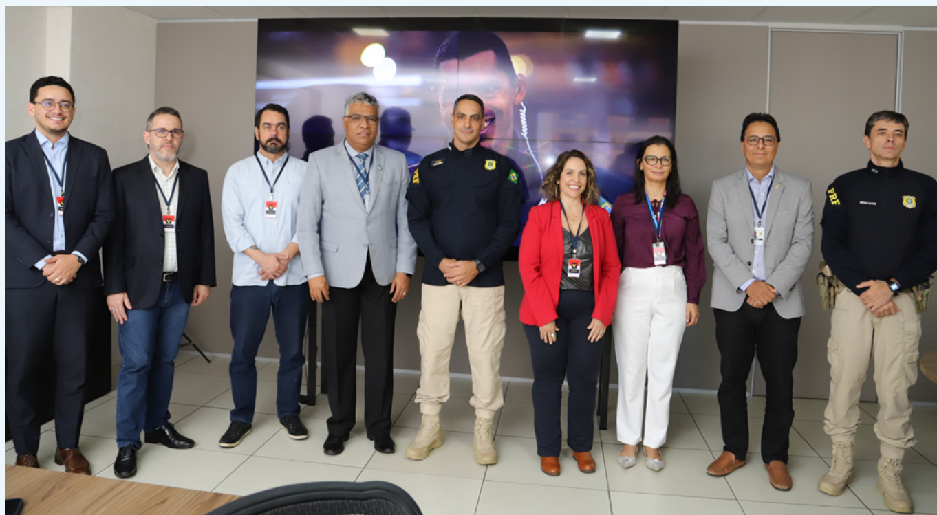
AGR e PRF-GO: parceria resultou em mais de 250 apreensões de veículos só no ano passado

Segundo o presidente da AGR, o trabalho de fiscalização e o combate ao transporte clandestino tem sido associado à questão da segurança. “Quem vive à margem da lei, por exemplo, não viaja no transporte regular, vai procurar o clandestino”, observou. Por isso, a Agência tem investido em parcerias, como a da PRF, a da Polícia Militar de Goiás e a Agência Nacional de Transportes Terrestres (ANTT), para uma maior segurança tanto para os passageiros quanto para os próprios fiscais, uma vez que as abordagens aos clandestinos também envolvem riscos. “Só no ano passado, mais de 250 veículos clandestinos foram apreendidos e levados aos pátios públicos credenciados”, disse.