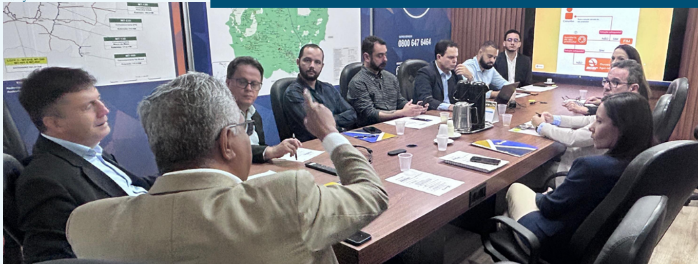
Durante visita, a AGR pôde conhecer experiências da Ager que podem ser pensadas para Goiás

Uma delegação da AGR realizou, nos dias 14 e 15 de abril, uma visita à Agência de Regulação dos Serviços Públicos Delegados do Estado de Mato Grosso (Ager). O objetivo foi a troca de experiências e o fortalecimento da regulação e fiscalização dos serviços públicos delegados nos dois estados, com ênfase no transporte de passageiros.