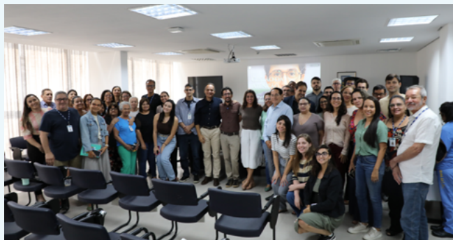
Participantes saíram da palestra com olhar renovado