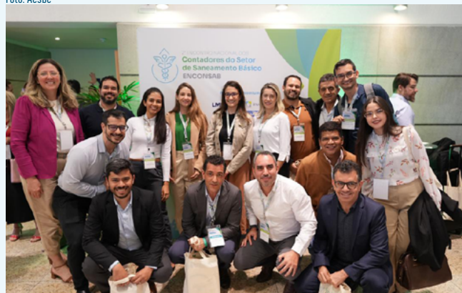
Colaboradores da AGR no 2º Enconsab