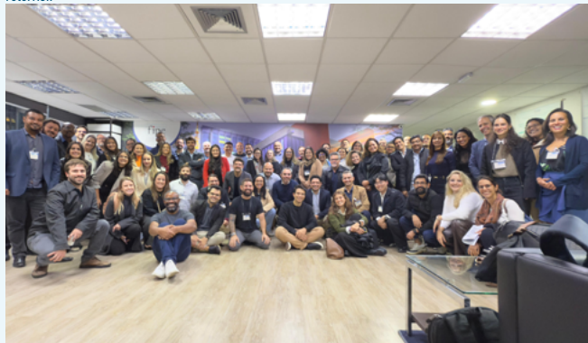
Profissionais de agências reguladoras selecionadas para o curso