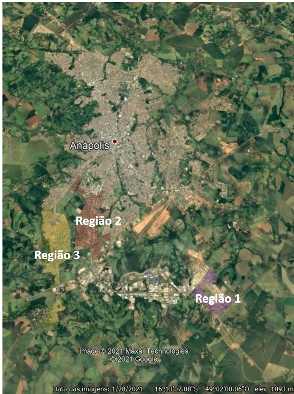
Figura 3 - Regiões abastecidas pelo Sistema DAIA