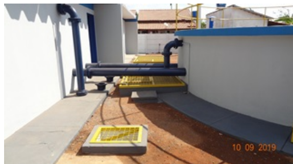
Foto 2 - Caixas de passagem com tampas de proteção recuperadas e RSE da ETA com pintura recuperada.