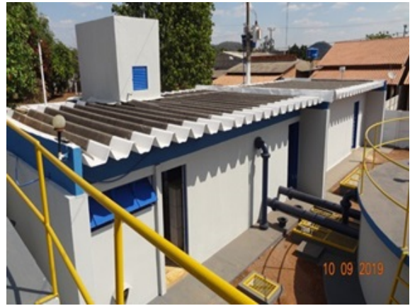
Foto 4 - Edificações da ETA com pinturas recuperadas.