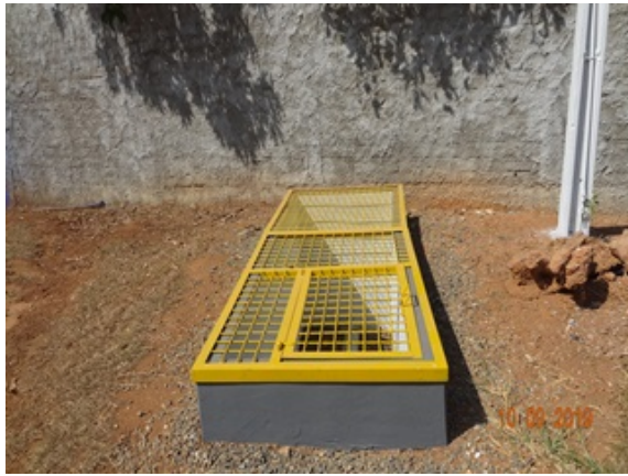
Foto 3 - Caixas de passagem com tampas de proteção recuperadas.