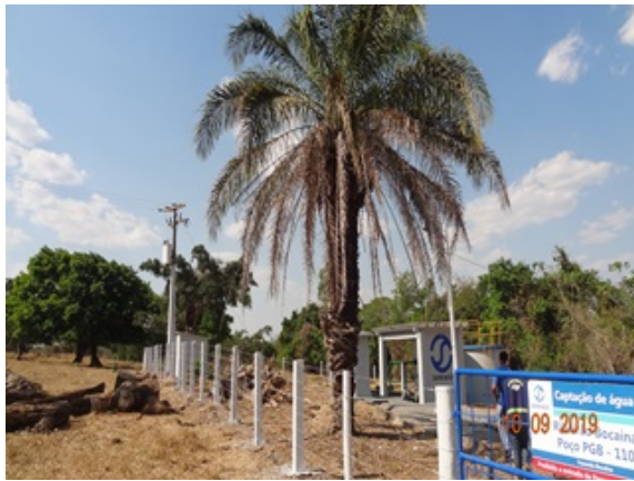
Foto 5 - Captação e poço com identificação.