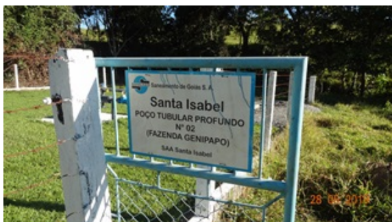
Foto 3 - Poço 02 com identificação.