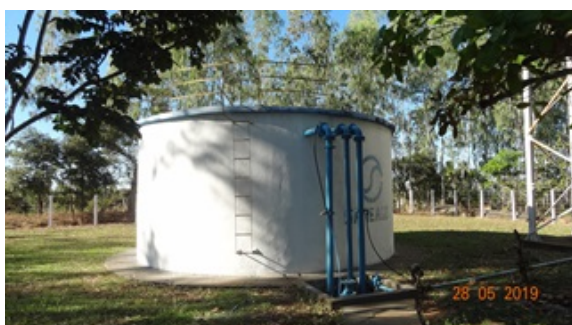
Foto 7 - RAP da ETA com pintura recuperada.