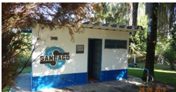
Foto 1 - Edificação do escritório antigo recuperada.