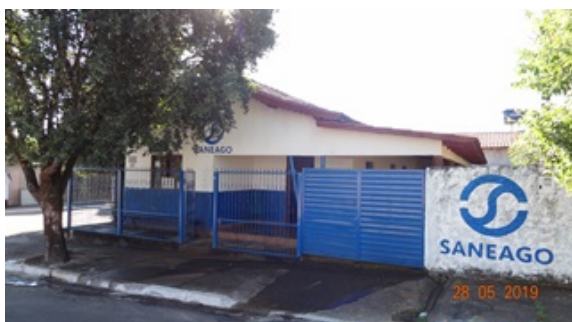
Foto 5 - Fachada do novo escritório da Saneago no distrito de Santa Isabel.