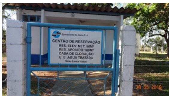
Foto 6 - ETA com placa de identificação recuperada.