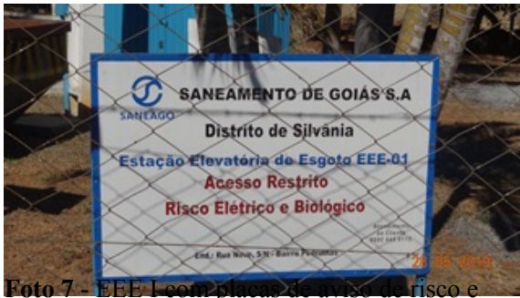
Foto 7 - EEE I com placas de aviso de risco e advertência recuperadas.