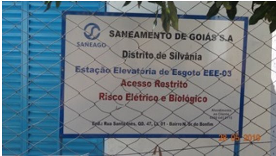
Foto 9 - EEE III com placas de aviso de risco e advertência recuperadas.