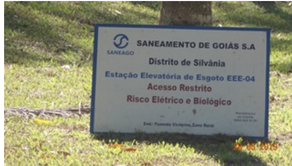
Foto 10 - EEE final (EEE IV) com placas de advertência recuperadas.