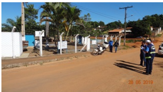
Foto 1 - EEE I com pintura recuperada.