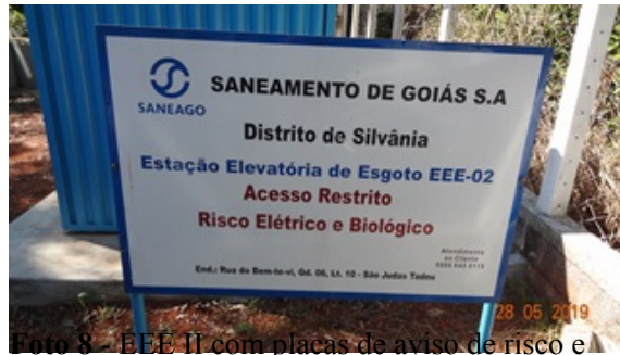
Foto 8 - EEE II com placas de aviso de risco e advertência recuperadas.