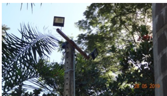
Foto 6 - EEE III com sistema de iluminação recuperado.