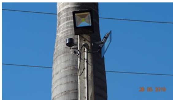
Foto 2 - EEE I com sistema de iluminação recuperado.