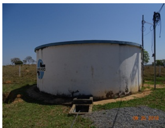
Foto 2 - Pintura desgastada.