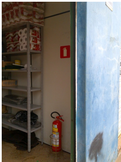
Foto 123 - Extintor providenciado