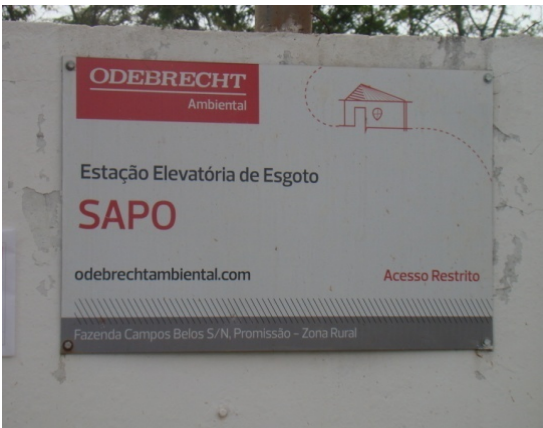
Foto 5 - Identificação - EEE