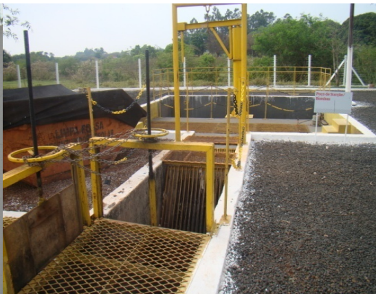
Foto 6 - EEE