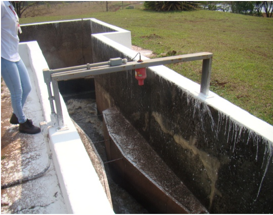
Foto 3 - Calha Parshall - ETE