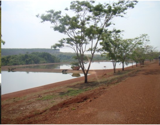
Foto 4 - Sistema lagoas ETE