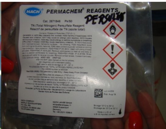
Foto 8 - Rótulo de reagente