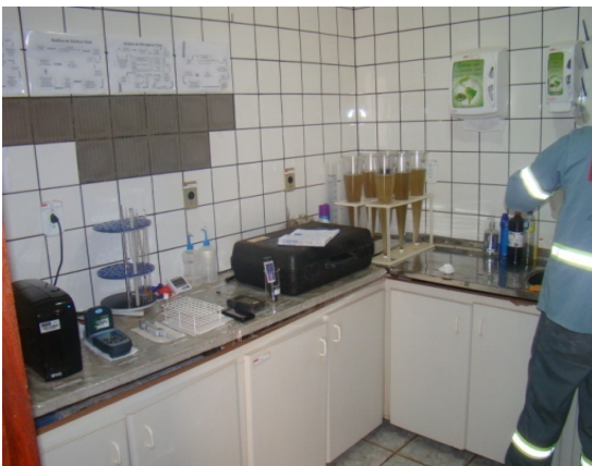
Foto 7 - Laboratório ETE