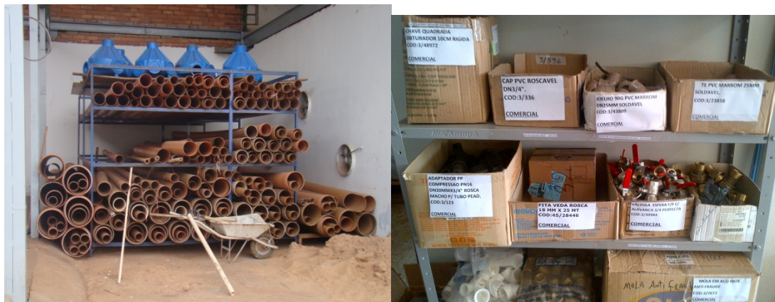
Foto 11 - Material estocado Foto 12 - Materiais etiquetados