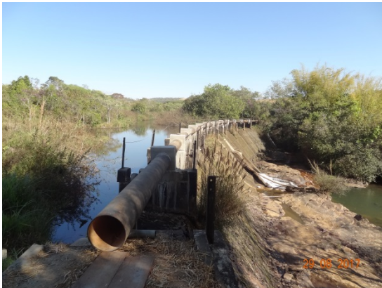
Foto 7 – Adutora da reversão Rio Capivari para Piarcó I em construção.