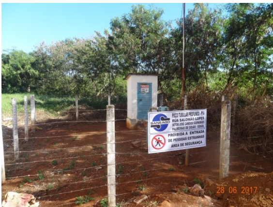
Foto 7 - Poço P14 com acesso fácil.