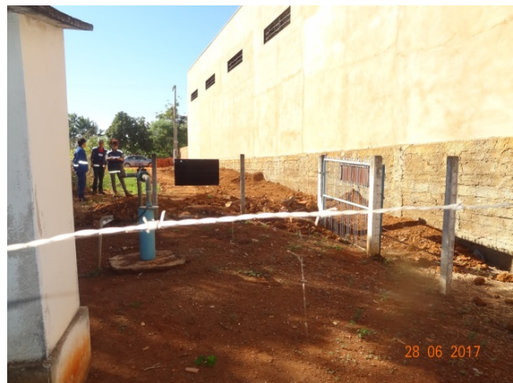
Foto 8 - Poço P14 com acesso fácil.