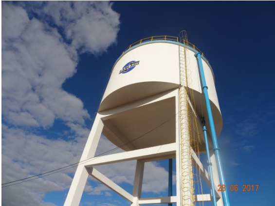
Foto 1 – REL do Distrito com ausência de infiltrações e pintura recuperada.