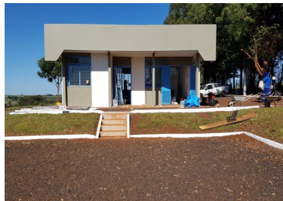
Foto 10 – Pintura do prédio da ETE