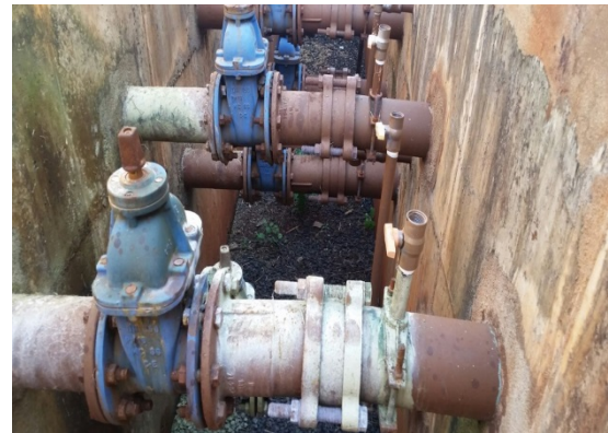
Foto 6 – Vazamento no registro dos reatores (novos) consertado