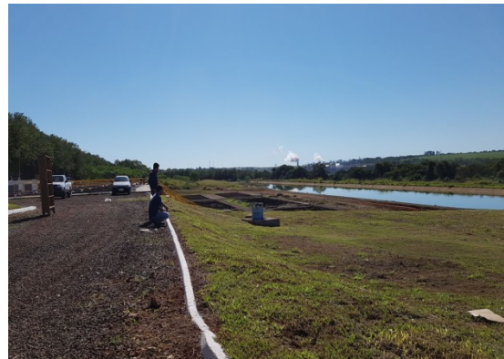
Foto 8 – Providenciada a limpeza e retirada de animais da área da ETE