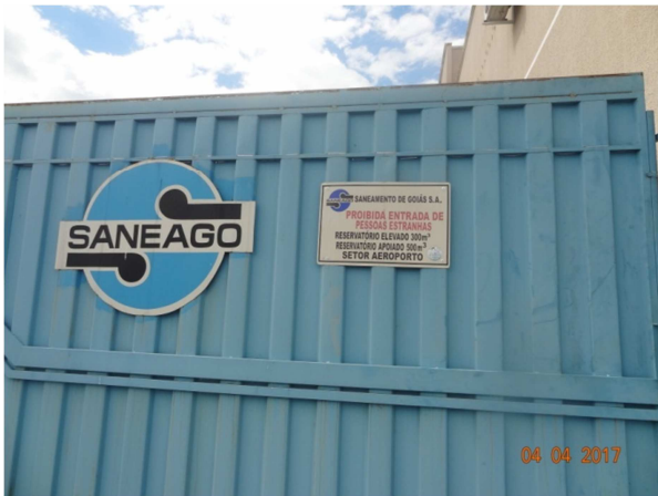
Foto 7 - Instalação de identificação na área do reservatório - Setor Aeroporto