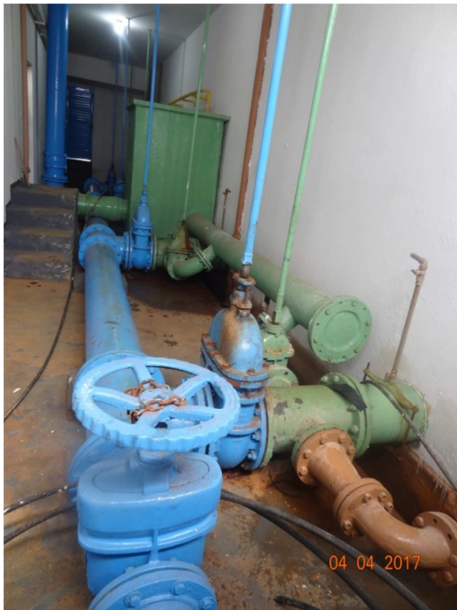
Foto 5 - ETA - Pintura reparada - área de filtração