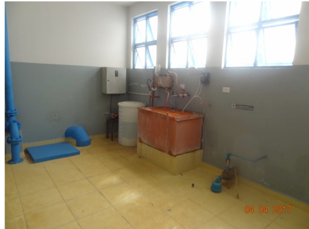
Foto 6 - ETA - Pintura reparada - Casa de Química