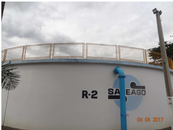
Foto 11 - Instalação de guarda-corpo - reservatório R2