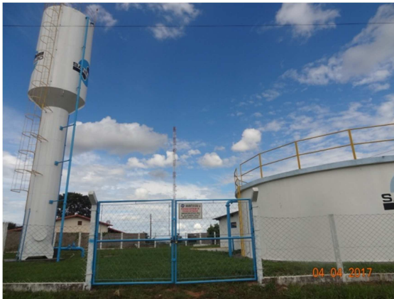
Foto 9 - Correção de infiltrações, mofo e eflorescências - RAP do Jardim Romano