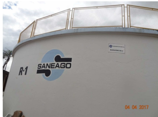
Foto 10 - Instalação de guarda-corpo - reservatório R1