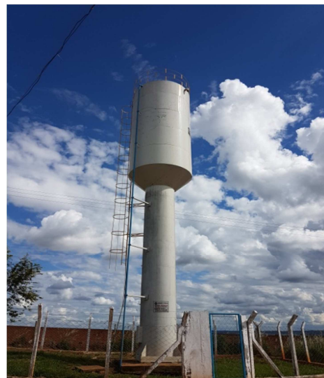
Foto 8 - Instalação de identificação na área do reservatório - Setor Sol Nascente