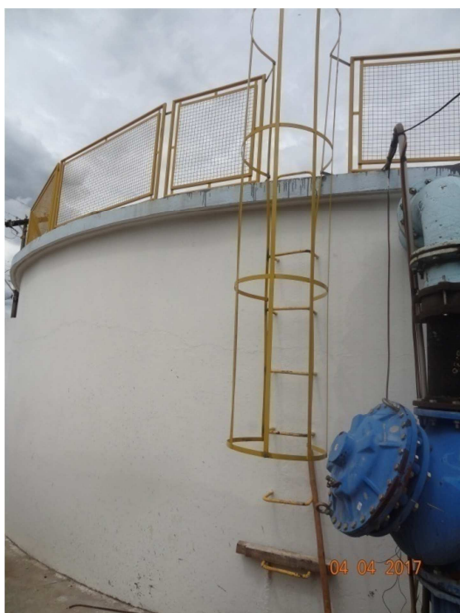
Foto 1 - ETA - Paredes externas sem infiltrações, perda de revestimento, eflorescências e pintura desgastada