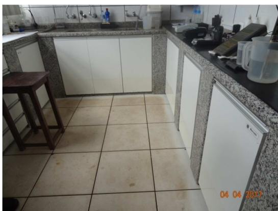
Foto 3 - ETA - armários reparados no Laboratório