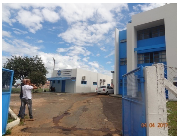
Foto 2 - ETA - Paredes externas sem infiltrações, perda de revestimento, eflorescências e pintura desgastada