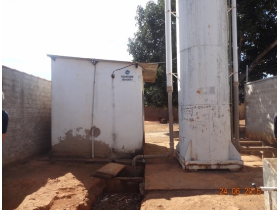
Foto 7- CR São Vicente – ausência de cerca/muro na parte dos fundos