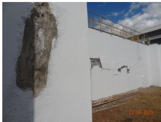
Foto 1- Tratamento das eflorescências - ETA