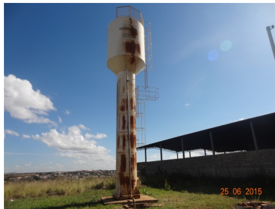
Foto 5 – Recuperação de eflorescências com impermeabilização interna