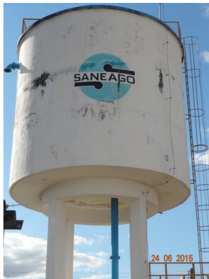
Foto 3- Instalação de cerca - CR Tesouro