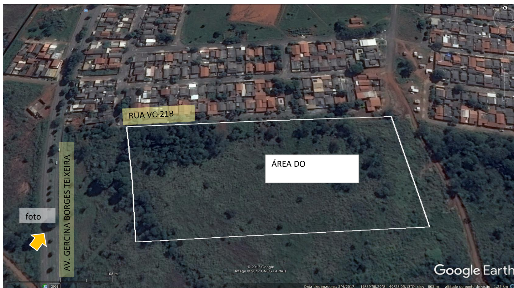
Foto 9: Imagem aérea da área do empreendimento e entorno imediato