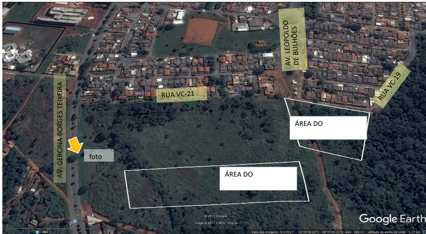
Foto 13: Imagem aérea da área do empreendimento e entorno imediato