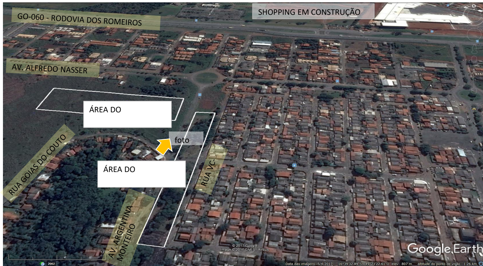
Foto 3: Imagem aérea da área do empreendimento e entorno imediato