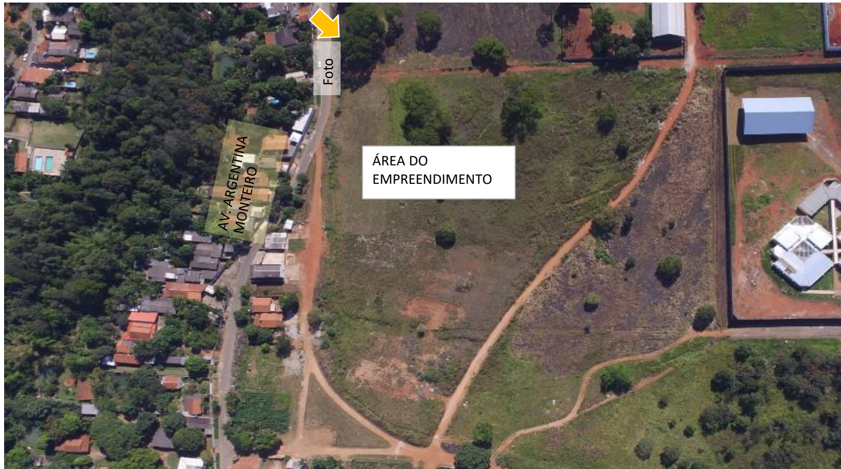
Foto 5: Imagem aérea da área do empreendimento e entorno imediato