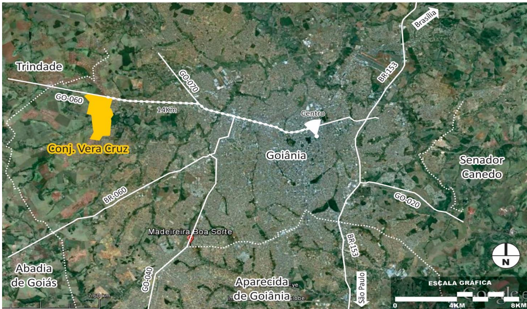
MAPA 1: Localização do Conjunto Vera Cruz na área urbana de Goiânia