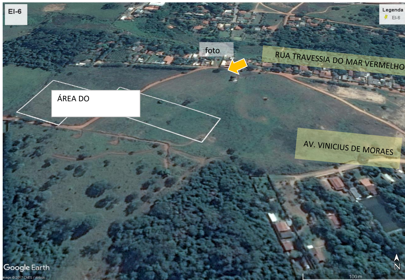
Foto 11: Imagem aérea da área do empreendimento e entorno imediato