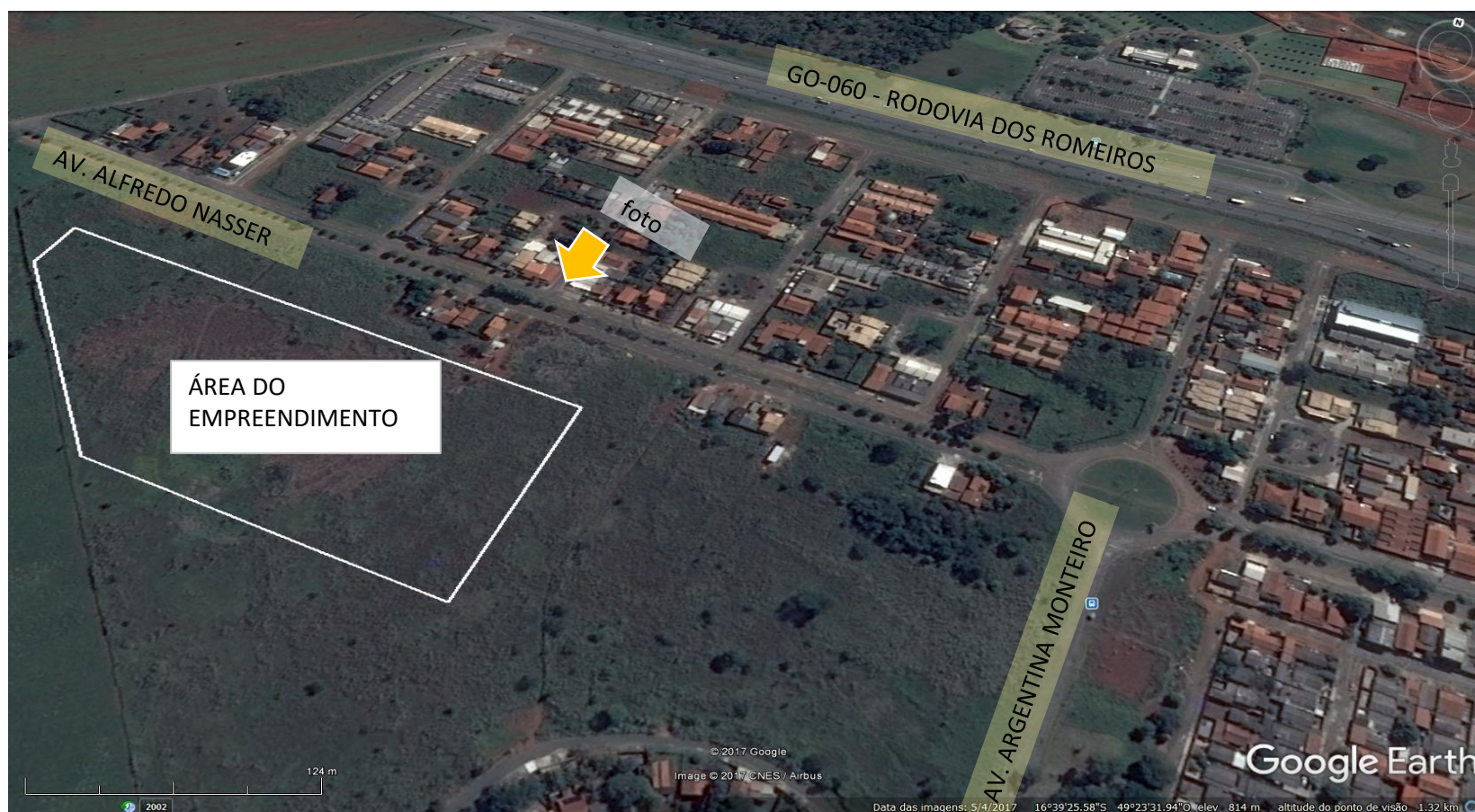
Foto 1: Imagem aérea da área do empreendimento e entorno imediato