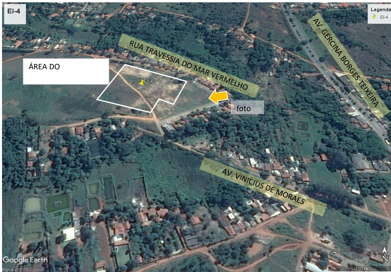
Foto 7: Imagem aérea da área do empreendimento e entorno imediato