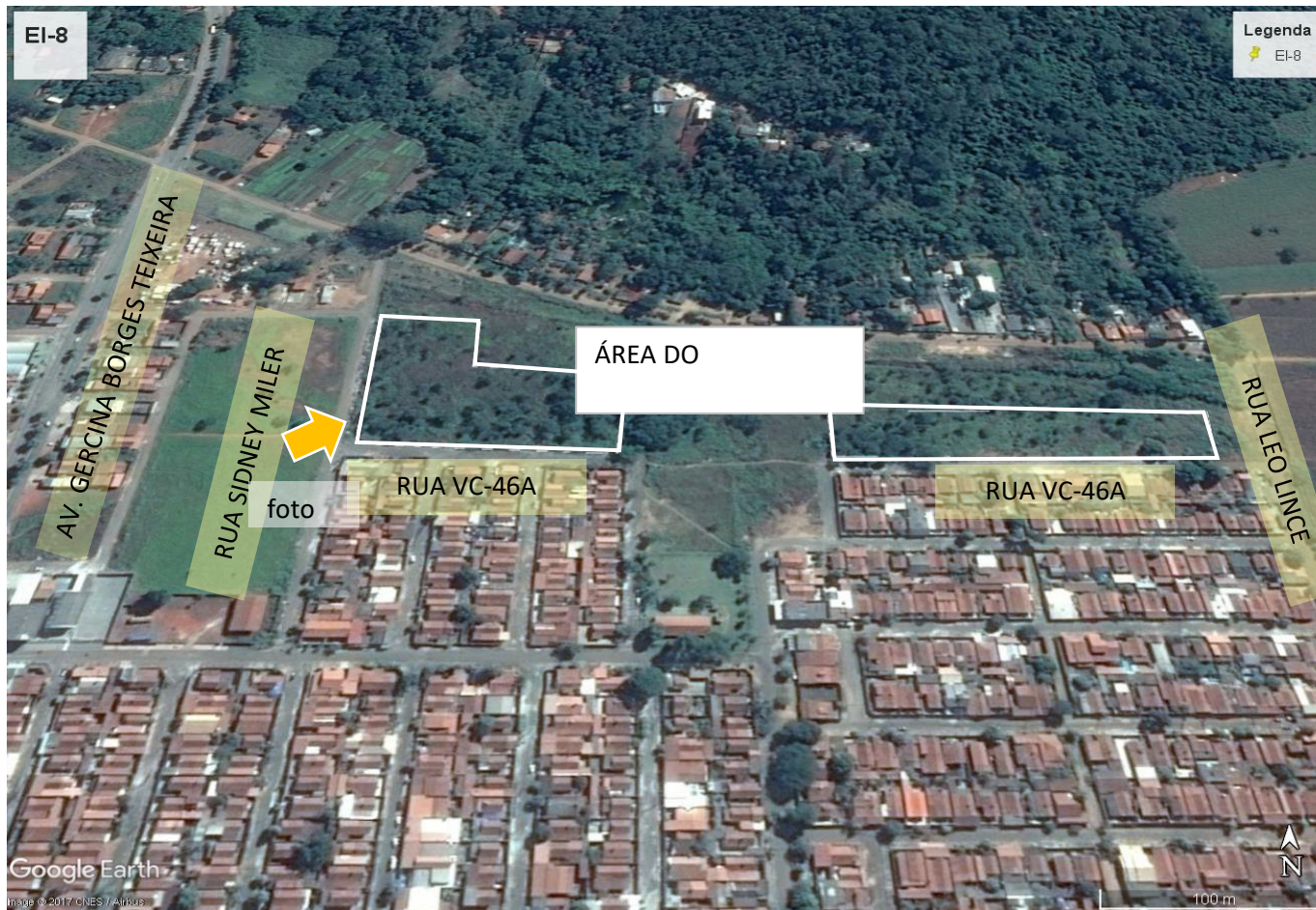
Foto 15: Imagem aérea da área do empreendimento e entorno imediato