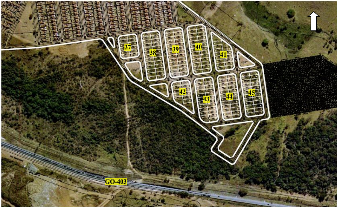
Figura 1 – Localização do Conjunto Valéria Perillo I – Quadras 37 a 45 – Senador Canedo/GO

No valor proposto incluir todos os serviços relacionados anteriormente e todos aqueles necessários para execução dos mesmos dentro do prazo de execução máximo estimado, assim como os custos associados com visita ao local dos ensaios, e quaisquer outras despesas com a elaboração da proposta, serão arcados pela empresa participante.