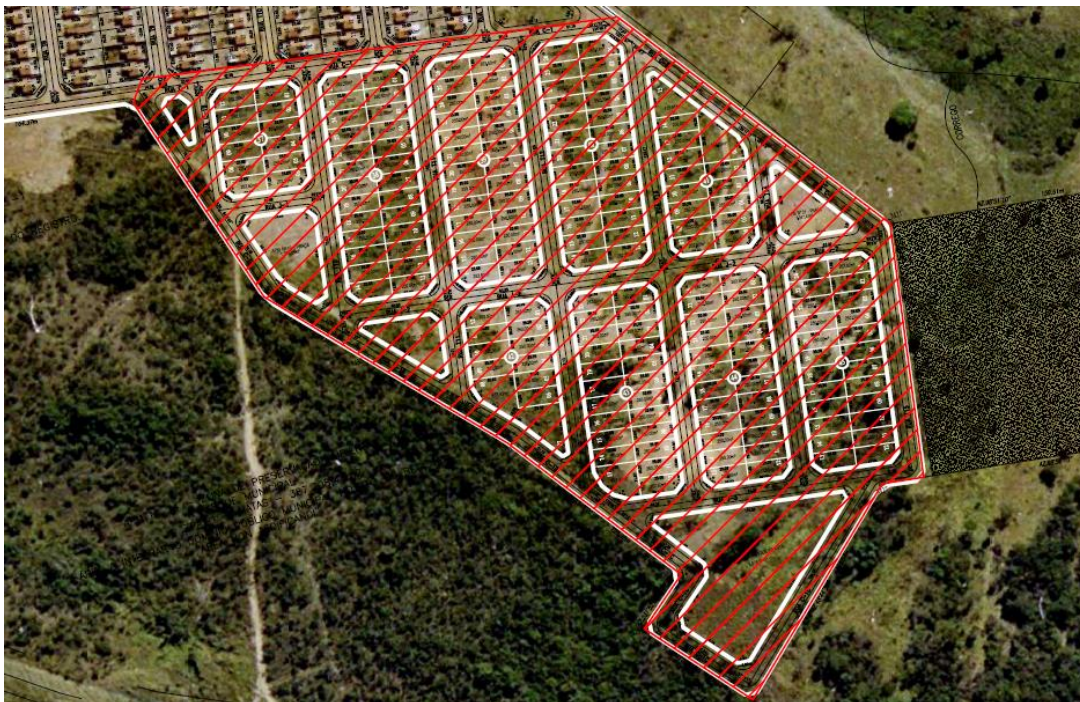
Figura 3 – Poligonal com a área objeto do Projeto Básico localizada no Conjunto Valéria Perillo I – Senador Canedo/GO