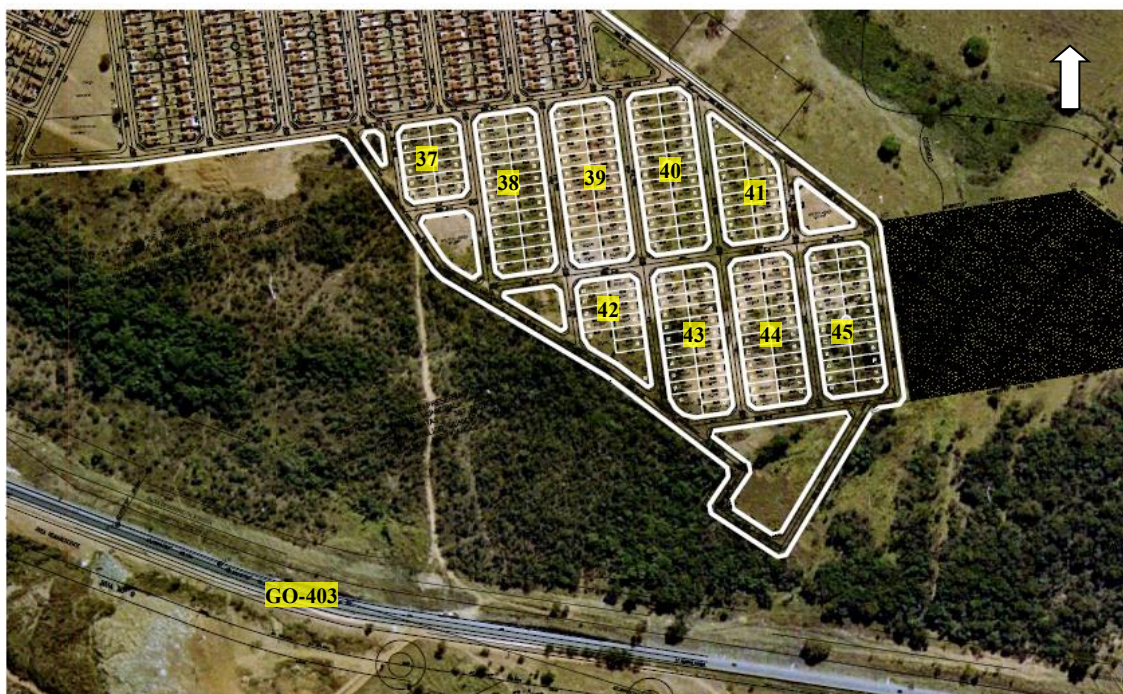
Figura 1 – Localização do Conjunto Valéria Perillo I – Quadras 37 a 45 e ruas de acesso as mesmas – Senador Canedo/GO