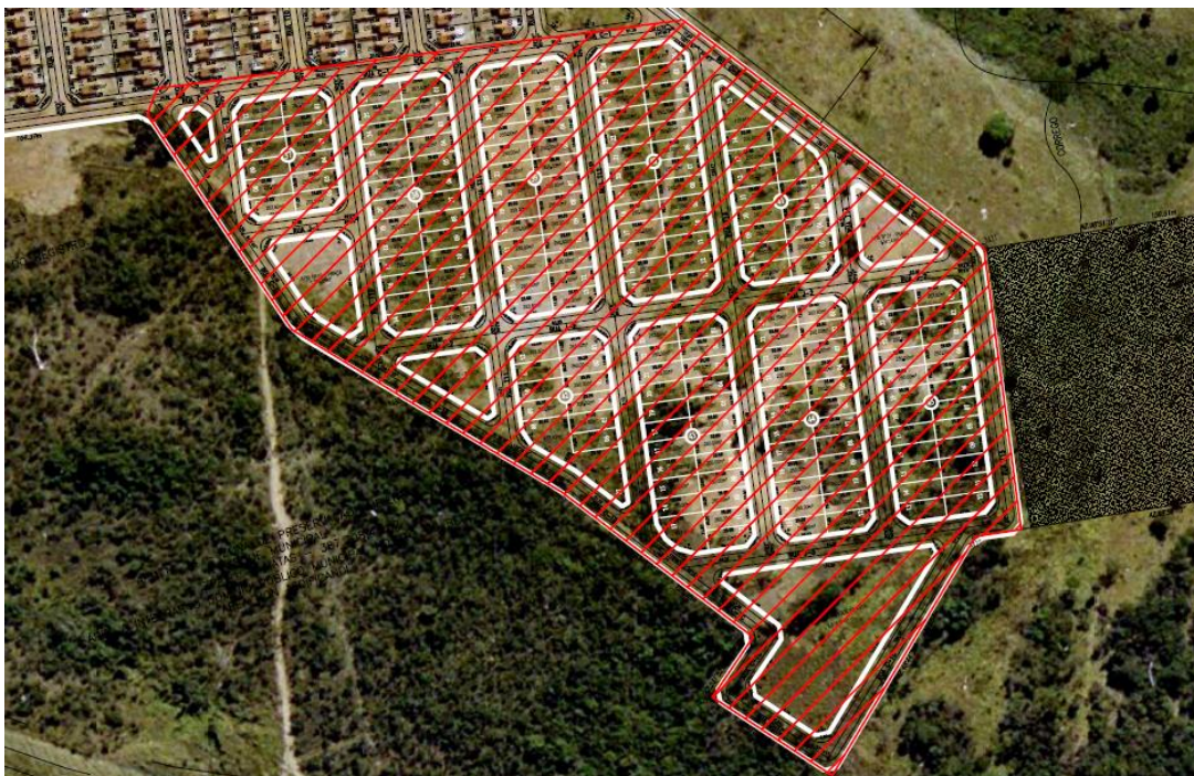
Figura – Poligonal com a área objeto do Projeto Básico localizada no Conjunto Valéria Perillo I – Senador Canedo/GO