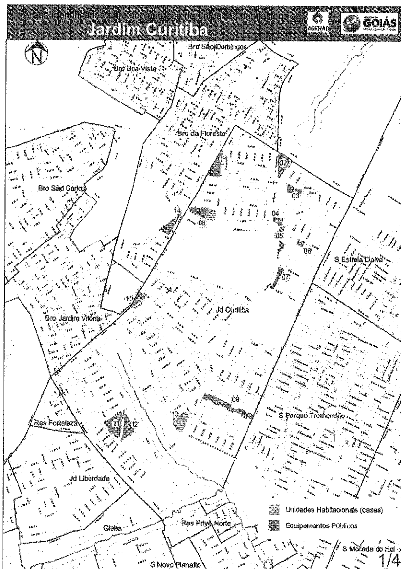
Figura 1 – Localização das Unidades Habitacionais