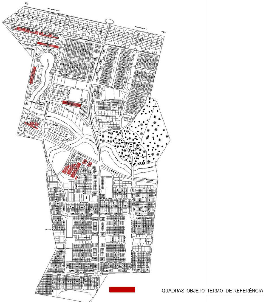
Figura 2 – Projeto do Loteamento – Conjunto Vera Cruz