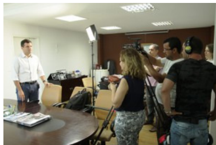
Equipe de filmagem entrevista presidente da Agehab, Marcos Abrão Roriz.

Data de publicação: 19 de novembro de 2013 - 16:35