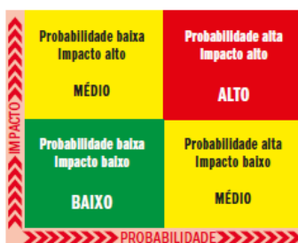
0.6. Figura 01 - Matriz de riscos simples

Utilizando-se da matriz de PROBABILIDADE x IMPACTO , imagem abaixo, conforme orientação do comitê de compliance desta Agência, temos a seguinte Matriz de Probabilidade x Impacto: