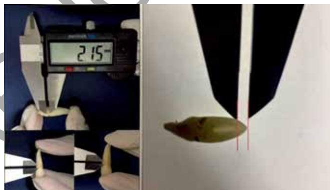
Ilustração das mensurações realizadas sobre a periodontose (esquerda) e a transparência radicular (direita).

Na obra Tratado de Antropologia Forense – Fundamentos e metodologias aplicadas à prática pericial , no capítulo 17, os autores Machado et al. discorrem a respeito de um método métrico para a estimativa de idade dental, cujos parâmetros levados em consideração no processo de estimativa de idade são a periodontose, a transparência radicular e o comprimento radicular, de acordo com a figura apresentada. Esse método é empregado para a estimativa de idade de adultos e é considerado invasivo, mas não destrutivo. Assinale a alternativa que nomeia o referido método.