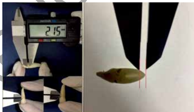
Ilustração das mensurações realizadas sobre a periodontose (esquerda) e a transparência radicular (direita).

Na obra Tratado de Antropologia Forense – Fundamentos e metodologias aplicadas à prática pericial , no capítulo 17, os autores Machado et al. discorrem a respeito de um método métrico para a estimativa de idade dental, cujos parâmetros levados em consideração no processo de estimativa de idade são a periodontose, a transparência radicular e o comprimento radicular, de acordo com a figura apresentada. Esse método é empregado para a estimativa de idade de adultos e é considerado invasivo, mas não destrutivo. Assinale a alternativa que nomeia o referido método.