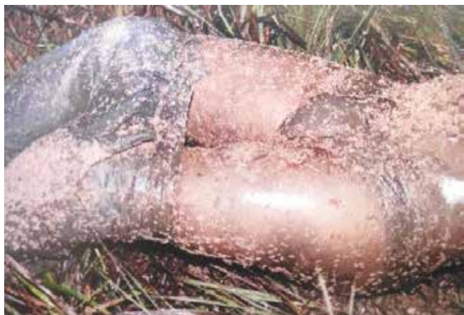
VELHO, Jesus Antônio et al. Ciências forenses: uma introdução às principais áreas da Criminalística moderna . 3. ed. Campinas: Millenium Editora, 2017.

A fotografia de local de crime apresentada evidencia parte do tronco e pernas de um cadáver, sobre solo com vegetação rasteira, que veste calça e cueca. Essa imagem também revela a grande quantidade de larvas sobre os vestígios. Com base exclusivamente na imagem da fotografia apresentada, assinale a alternativa que melhor discrimina o corpo de delito.