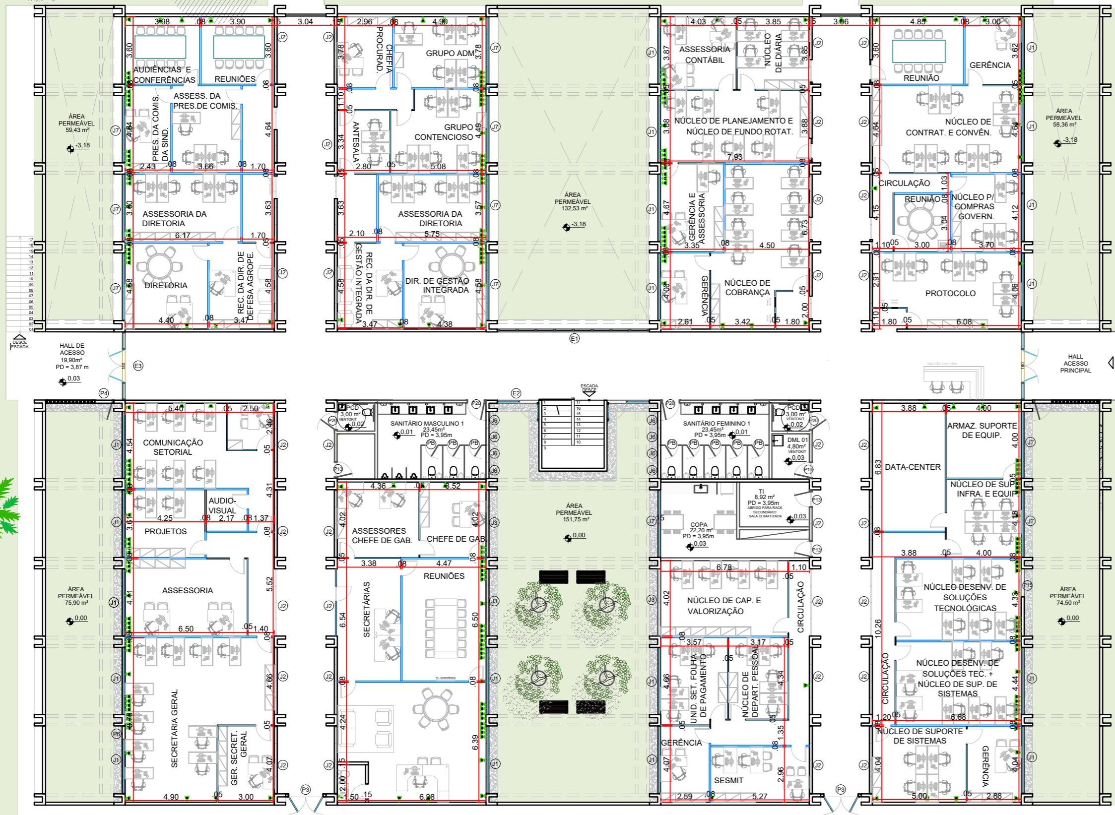
PLANTA BAIXA TERREO - PROPOSTA Escala 1/175