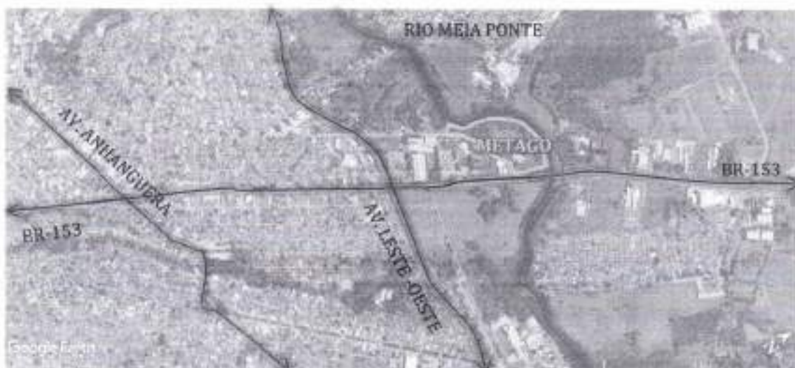
Localizado próximo aos principais eixos estruturadores

Este projeto básico tem por finalidade a contratação de empresa jurídica de arquitetura e/ou engenharia, especializada e habilitada para a prestação de serviços técnicos para elaboração de projetos executivos de reforma e modificação com acréscimo de prédios pertencentes à METAGO em liquidação , situados à Avenida Laurício Pedro Rasmussem, Vila Yate, Goiânia – GO/Rodovia BR 153, Qd. Área - s/n Área 1, Goiânia - GO, conforme quantitativo deste projeto.