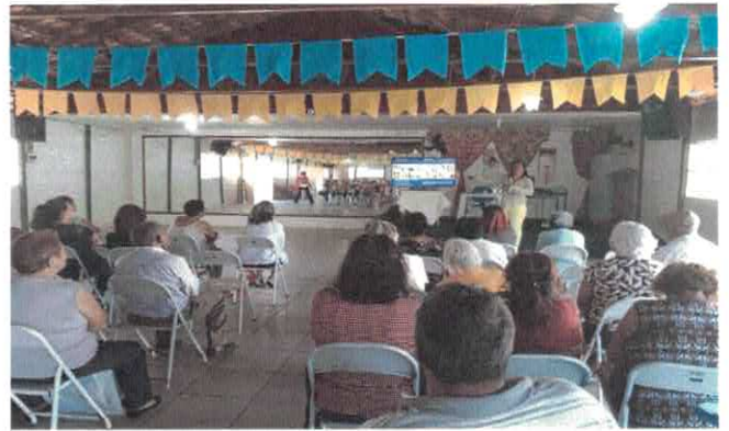
CGV - Palestra Capacitando Voluntários na Vila Vida.