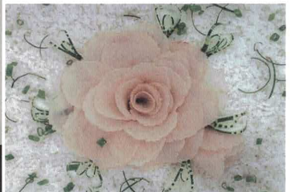
Rest. Cidadão - Decoração na unidade de Goianésis;