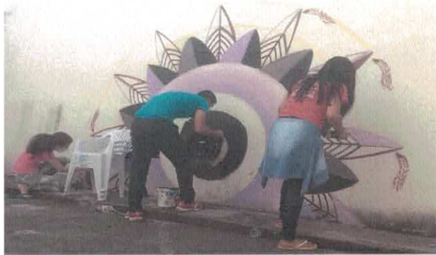
CCA Oficina de Grafite - Casa de Apoio Amor e Vida