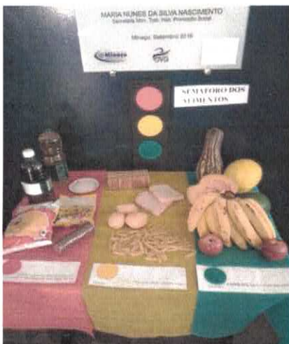
Rest. Cidadão - Dica Nutricional no mural da unidade de Minaçu.