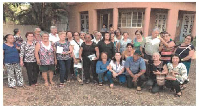
CCI-CM - Visita ao Museu Pedro Ludovico.