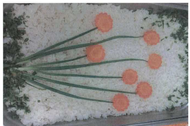
Rest. Cidadão - Decoração na unidade Centro de Anápolis