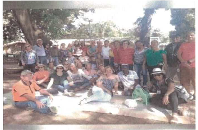
CCI-NF - Passeio e piquenique no Zoológico