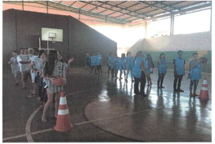
CCA - II Gincana Solidária.