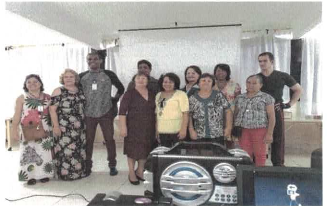
CCI-NF - Manhã Cultural. Filme: "OS LIRIOS NÃO MURCHAM"