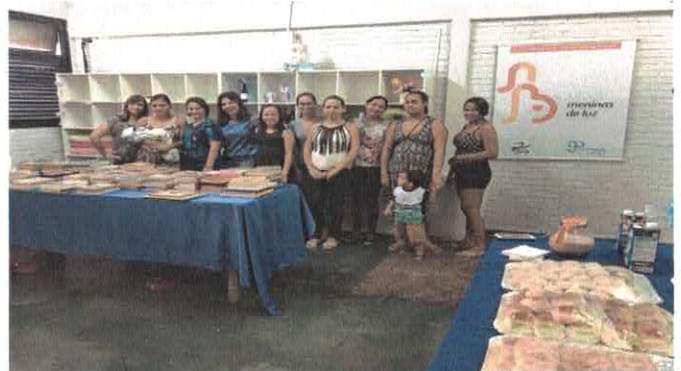
CSDGB - Inauguração de Biblioteca no Programa Meninas de Luz em Porangatu.