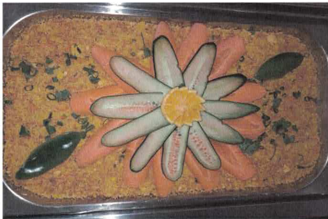
Rest. Cidadão - Decoração na unidade de Águas Lindas.