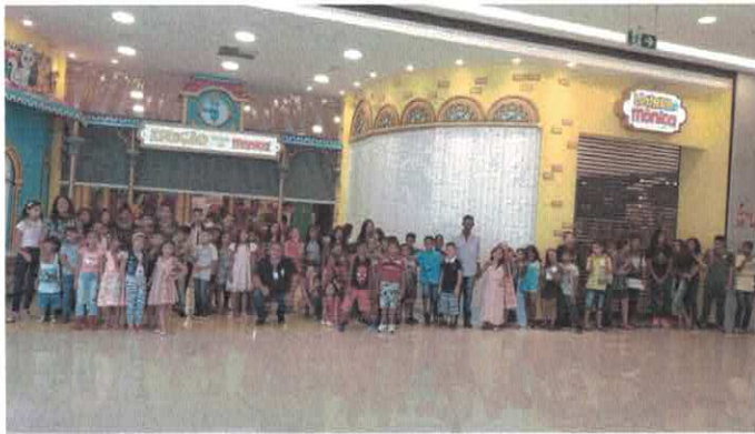
CGV - Crianças Creche Associação Beija-Flor. Visita ao Parque da Criança Turma da Mônica.