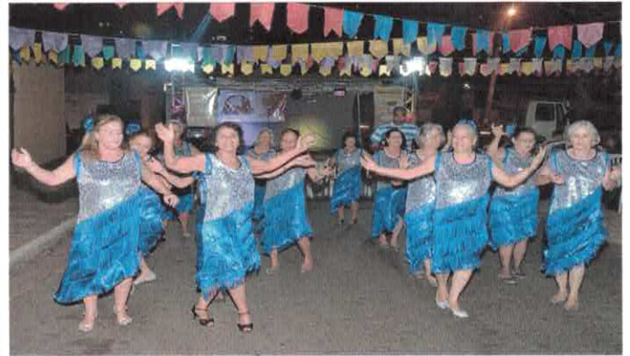
CCI-CM - Grupo Terceira Dança na Festa Junina do Jd. Nova Esperança.