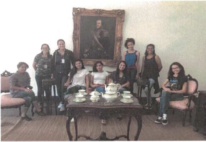
CCA -Visita ao Palácio Conde dos Arcos, na cidade de Goiás.