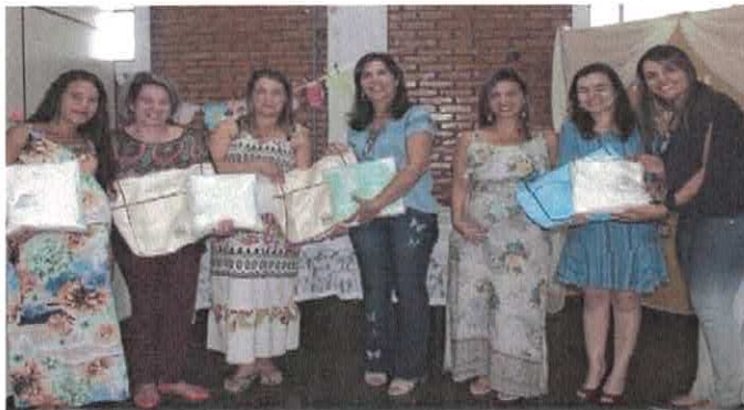
CSDGB - Monitoramento e entrega de envelopes para as gestantes do Meninas de Luz em Orizona.