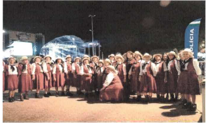
CCI-NF - Grupo Terceira Dança no Arraiá do Cerrado Praça Cívica.