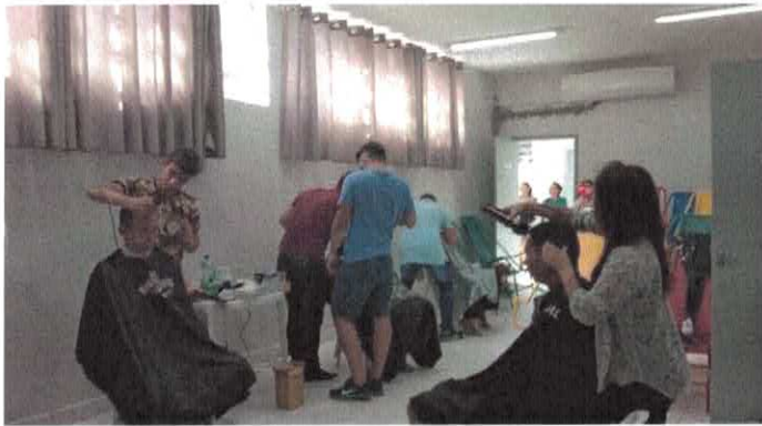
CIGO - Voluntários da Academia de Barbeiros Coronel Moustache atendem os usuários.