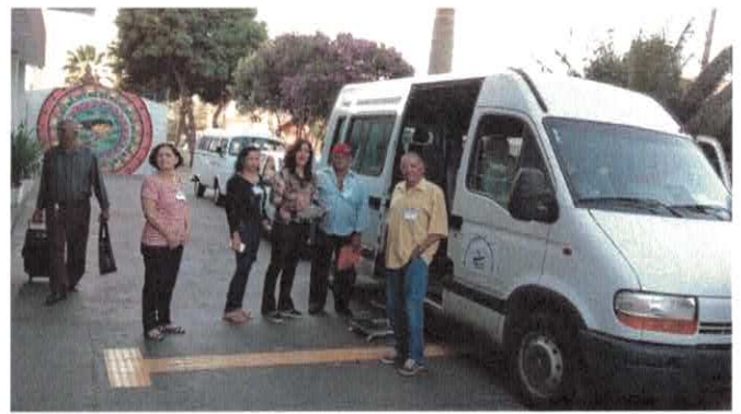
CIGO - Transporte dos usuários.