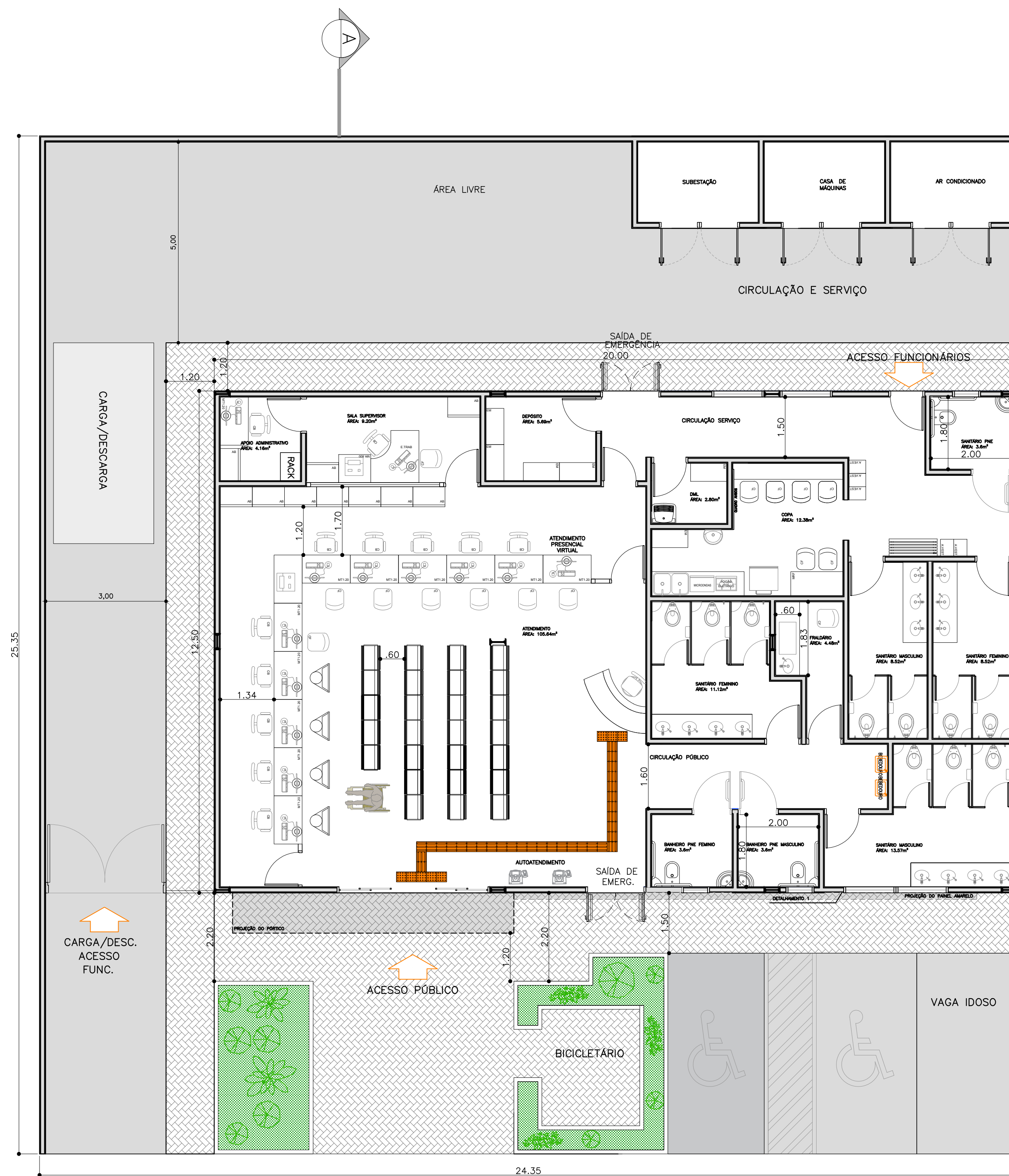
LAYOUT PEQUENO 250 m 2 PAV. TÉRREO ESC. 1:75