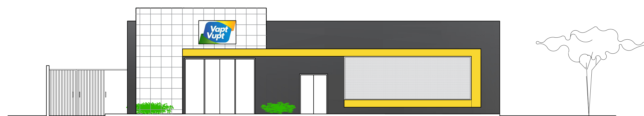
LAYOUT PEQUENO FACHADA ESC. 1:100