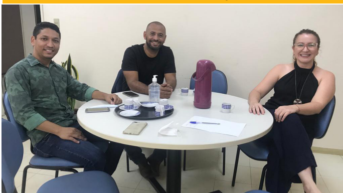
Reunião com a Superintendência da Juventude de Goiânia