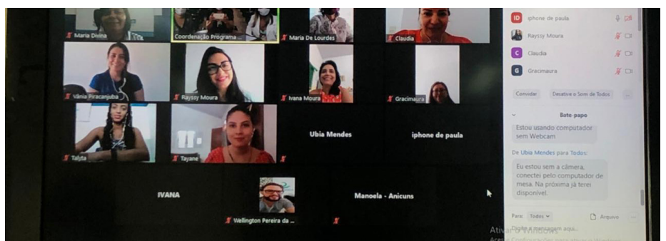
Turma de capacitação remota dos novos supervisores do Programa Criança Feliz para os municípios de Anicuns, Araguaças, Campo Limpo de Goiás, Carmo do Rio Verde, Jaraguá, Ipameri, Iaciara, Itapirapuã, entre outros,