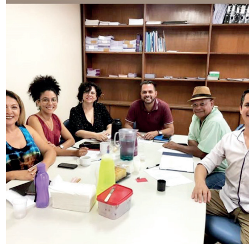
união da equipe da Gerência da Diversidade Sexual com parceiros para a construção de um Goiás mais humano por meio da oferta de workshops para servidores públicos em Goiás.