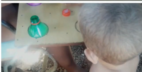
A Equipe Estadual do Programa Criança Feliz acompanha os visitantes do município de Trindade nas visitas as famílias mais vulneráveis.