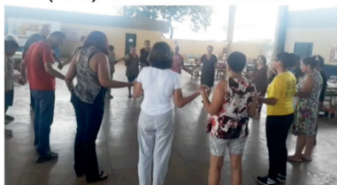
A Gerência de Promoção dos Direitos da Pessoa Idosa realiza Oficina de Artesanato no Centro de Referência e Convivência Da Pessoa Idosa (CRCI) do Jardim Novo Mundo.