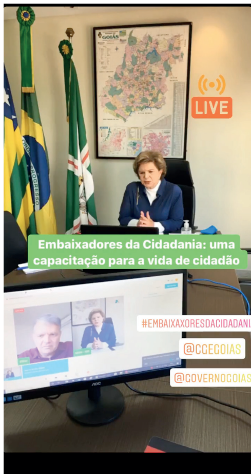
Embaixadores da Cidadania: uma capacitação para a vida de cidadão

#EMBAIXADORESDACIDADANIA @CGEGOIAS @GOVERNOGOIAS