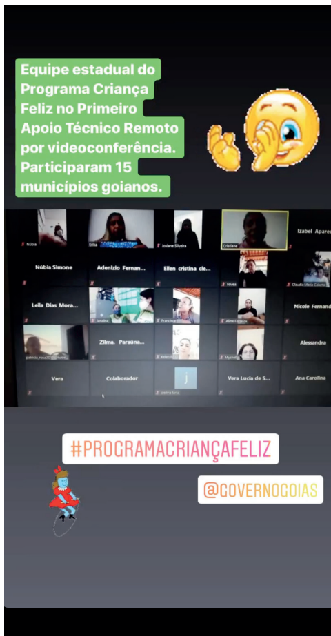
Equipe estadual do Programa Criança Feliz no Primeiro Apoio Técnico Remoto por videoconferência. Participaram 15 municípios goianos.

#EMBAIXADORESDACIDADANIA @CGEGOIAS @GOVERNOGOIAS