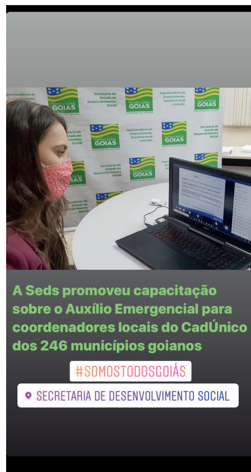
A Seds promoveu capacitação sobre o Auxílio Emergencial para coordenadores locais do CadÚnico dos 246 municípios goianos