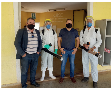
Case de Luziânia