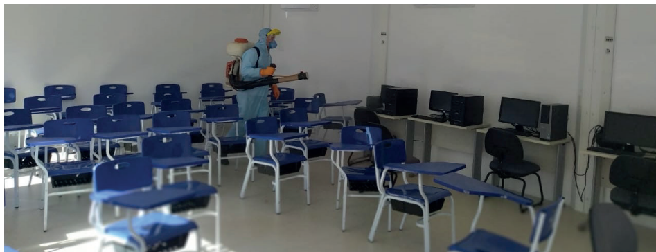
Case de Goiânia