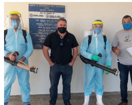
Case de Formosa