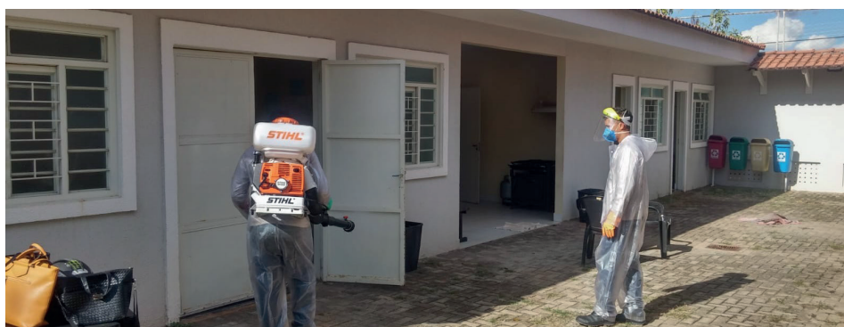
Casa de Semiliberdade