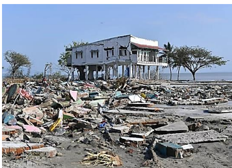
Figura 1. Tsunami no sudeste asiático no ano de 2004

62) A Figura 1 a seguir descreve um fenômeno denominado tsunami. Esse fenômeno atingiu diversos países do sudeste asiático ao final de 2004, causando mais de 220.000 mortes e uma vasta destruição.